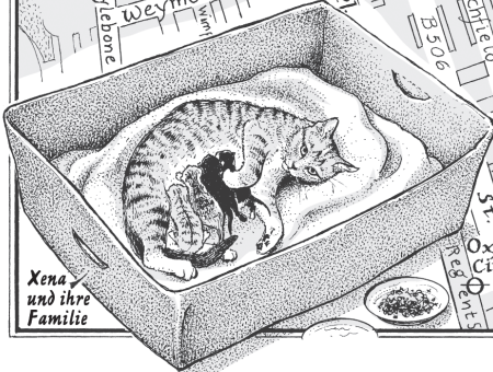
Xena und ihre Familie