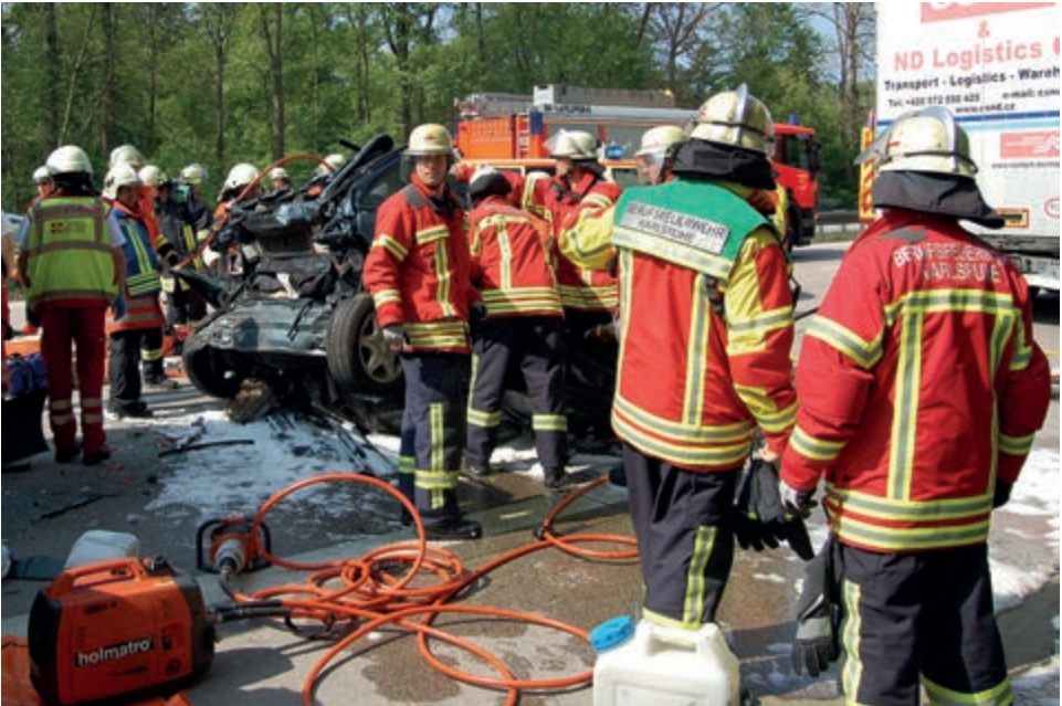
Bild 2: Feuerwehr ist Teamarbeit – nicht selten muss das Team unter Zeitdruck funktionieren. Detaillierte Absprachen sind oftmals nicht möglich, sodass die grundsätzlichen Überlegungen, Zielvorgaben und Handlungsabläufe im Vorfeld besprochen und trainiert sein müssen.

Der Zeitdruck an der Einsatzstelle erlaubt es meistens nicht, ausgiebige Lagebesprechungen durchzuführen. Bestimmte Handlungsabläufe müssen standardisiert sein und auf Zuruf ausgeführt werden können. Die grundsätzliche Denkweise der Führungskräfte muss der Mannschaft schon im Vorfeld vermittelt worden sein. Will man, wie in diesem Buch angeregt, zum Beispiel in bestimmten Lagen künftig mit einer modifizierten Taktik arbeiten und ungewohnte Wege beschreiten, so muss die Mannschaft durch Vorträge, Diskussionen und praktische Übungen darauf vorbereitet sein, um an der Einsatzstelle Diskussionen und Fehlinterpretationen zu vermeiden.