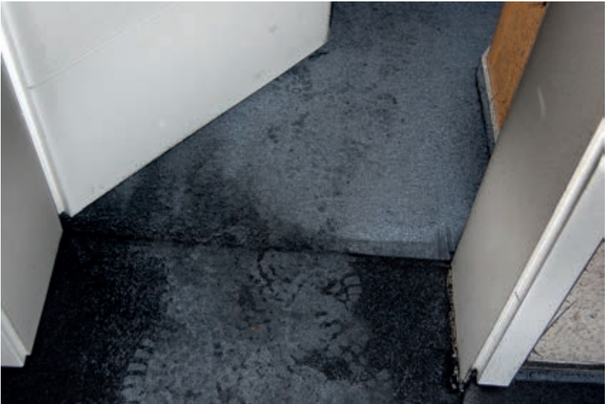
Bild 3: Abdrücke von kontaminierten Einsatzstiefeln jenseits der Schwarz/Weiß-Grenze lassen sich nicht immer vermeiden, sollten in manchen Fällen aber zum Nachdenken anregen.

Es wird uns nie gelingen, fehlerfrei zu arbeiten, perfekt zu werden. Wir müssen jedoch unsere Fehler erkennen und sie bewusst machen. Wir müssen nach den Ursachen der Fehler suchen und konsequent an der künftigen Vermeidung dieser Fehler arbeiten (Qualitätsmanagement). Die häufig gebrauchten Argumente wie »das haben wir immer schon so gemacht« beziehungsweise »das haben wir noch nie so gemacht« helfen uns dabei nicht weiter.