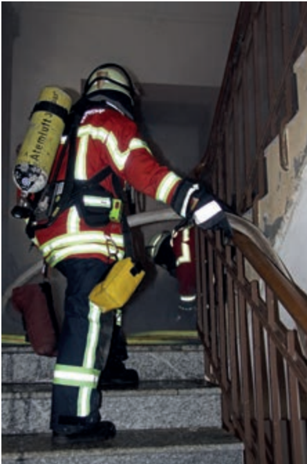
Bild 5: Treppenträume und Flure sind die Standard-Angriffswege der Feuerwehr. Es sind aber auch die baulichen Rettungswege für die Nutzer des Hauses und gleichzeitig die Zugänge, über die diese nach dem Brand wieder zu ihren Nutzungseinheiten gelangen sollen. Es gilt daher, Treppenträume und Flure auch im Zuge der Einsatzmaßnahmen nach Möglichkeit nicht zu verrauchen und/oder zu verschmutzen.