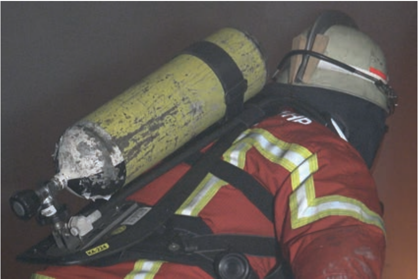
Bild 4: Der Holzkeil am Helm kann zielführend sein, sofern er mit Verstand eingesetzt wird.