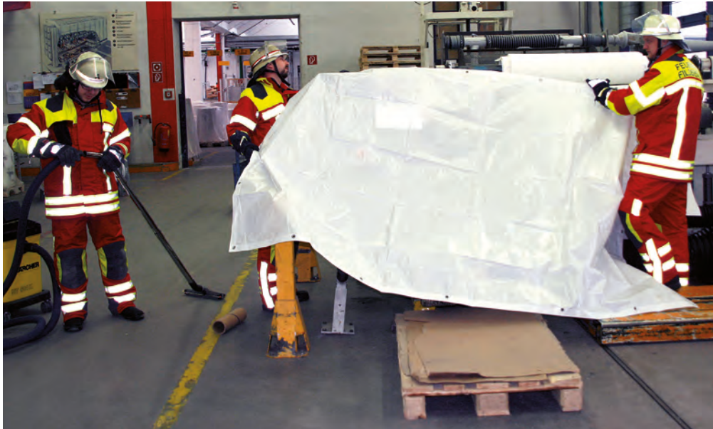
Bild 1.3 Zur Kundenorientierung gehört auch das Business-Continuity-Management. Die Feuerwehr könnte dabei z. B. noch während der Brandbekämpfung Maschinen vor Wasser schützen.

raum bekämpft werden. Gleiches gilt für einen Zimmerbrand, der eventuell über einen Balkon oder das Fenster mittels Leitern der Feuerwehr erreicht und gelöscht werden kann.