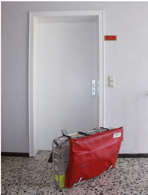
Bild 1.2 Beispiel für die schadenarme Einsatztaktik: Ein Mobiler Rauchverschluss wird am Schlauchtragekorb mitgeführt und kann so vor dem Eindringen in die Wohnung zur Verhinderung einer unkontrollierten Rauchausbreitung in den Treppenraum schnell montiert werden.

Dem hohen Vertrauen der Bevölkerung in die Fähigkeiten der Feuerwehrangehörigen ist natürlich auch die hohe Erwartungshaltung des Hilfesuchenden bzw. Betroffenen geschuldet: Er erwartet – zu Recht! – eine schnelle, pro-