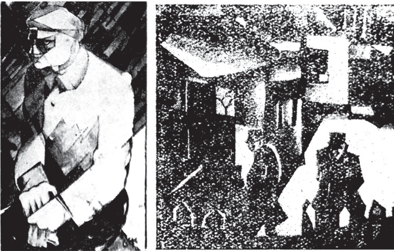
Werke von Ai Qing, 1929

Dieses Eintauchens in die französische Kunstszene hatte nicht zuletzt die glückliche Folge, dass eins seiner eigenen Bilder zu einer Frühlingsausstellung in dem gefeierten, trendsetzenden Salon des Indépendants auserwählt wurde. Es war ein kleines Ölgemälde eines arbeitslosen Arbeiters, das weniger von seinen politischen Ansichten als von seinen Gefühlen als Außenseiter inspiriert war. Doch die Zulassung zu der Ausstellung hob sein Selbstwertgefühl.