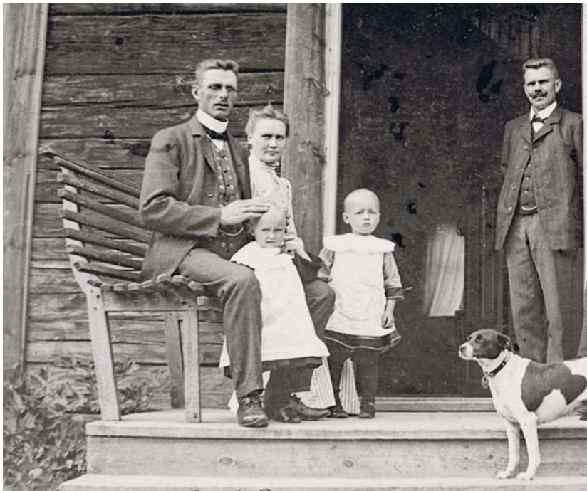
Vimmerby, August 1909. Samuel August Ericsson, seine Ehefrau Hanna und ihre beiden ältesten Kinder Astrid und Gunnar zu Besuch bei Verwandten. Wie auf so vielen anderen Fotos hat sich Astrid in die Arme ihres Vaters geflüchtet.

lässt sich auf zwei Botschaften verkürzen, die auch für ein Kind auf Näs in den Jahren 1910 bis 1920 galten: »Man müsse auf das verzichten, was weniger nötig sei, um das zu bekommen, was nötiger sei«, und »Nur wer arbeite und die Arbeit lieben gelernt habe, könne jemals glücklich sein«.