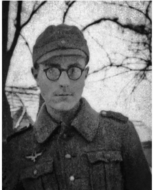
Als Luftwaffenhelfer im Spätherbst 1944

Typische Stellung eines unserer 3,7-cm-Flakgeschütze, mit denen unsere Batterie, rund um das Hydrierwerk Zeitz/Töglitz platziert, aus Braunkohle gewonnenes Benzin für die Wehrmacht sichern sollte. Erwachsene Soldaten wurden für den Fronteinsatz ausgekämmt, und so standen bald nur noch Luftwaffenhelfer an den Geschützen.