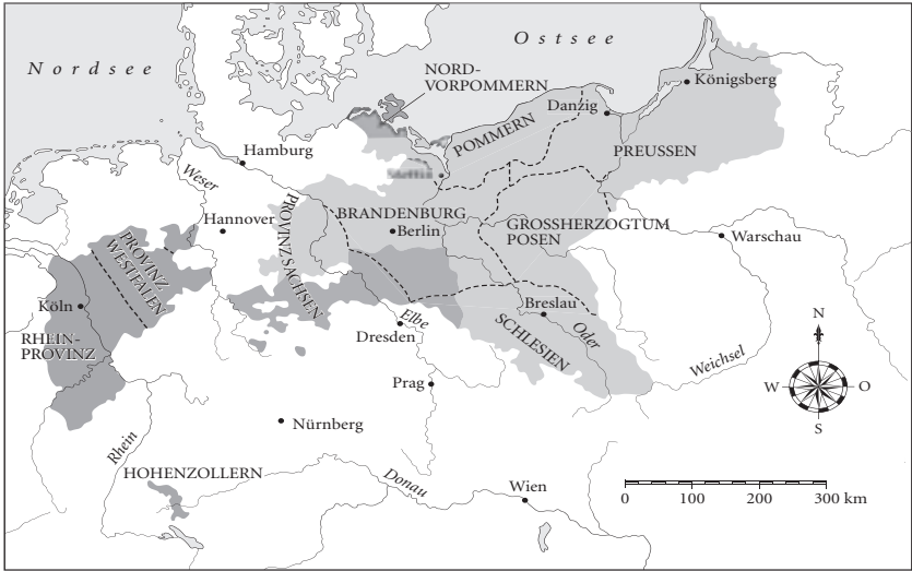
Preußen nach dem Wiener Kongress (1815)