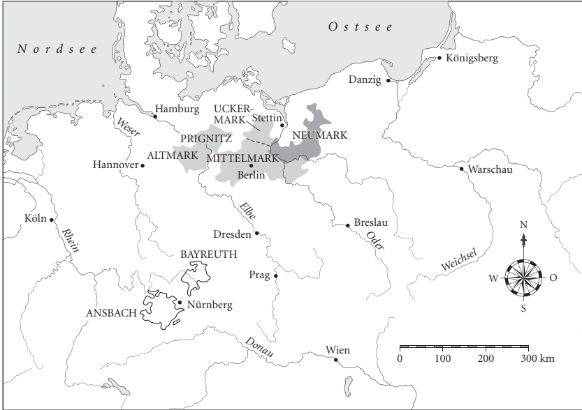
Das Kurfürstentum Brandenburg zur Zeit seines Erwerbs durch die Hohenzollern im Jahr 1415