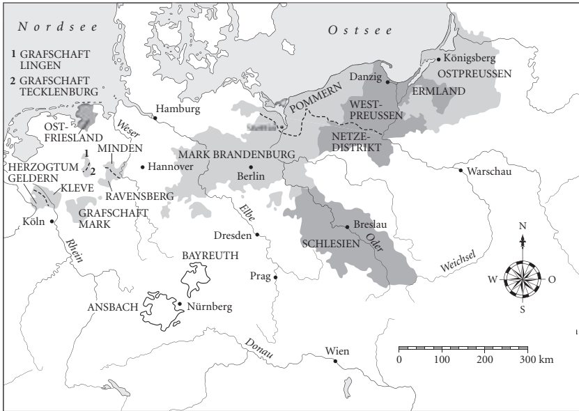
Das Königreich Preußen zur Zeit Friedrich des Großen (1740–1786)