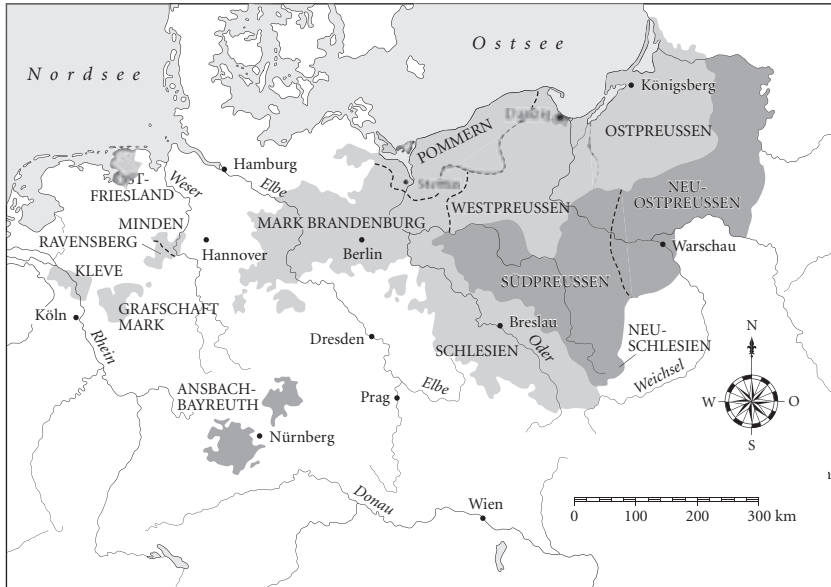
Preußen unter Friedrich Wilhelm II. mit den in der zweiten und dritten Teilung Polens (1793/1795) hinzugewonnenen Gebieten