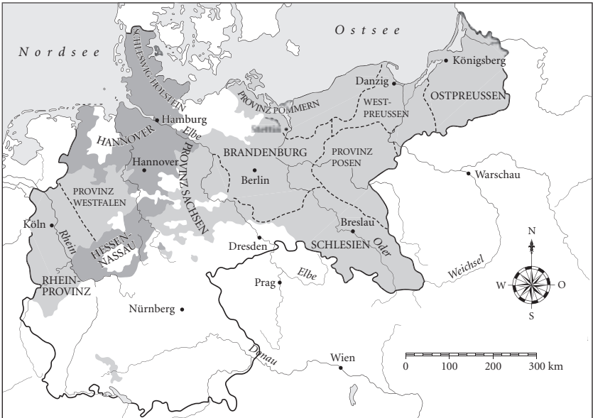
Preußen zur Zeit des Kaiserreichs (1871–1918)