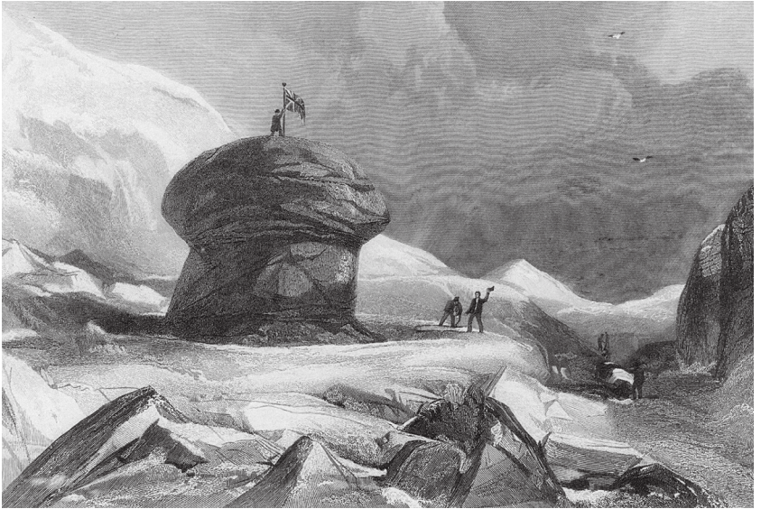
Ein triumphaler Moment in der Geschichte der Polarexpeditionen: James Clark Ross erreicht 1831 den magnetischen Nordpol.