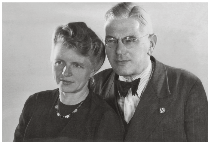
Vater trug stets das Parteiabzeichen Hitlers. Mutter hatte auch so eins.

Nation. Weil er den »frevelhafte« Vertrag von Versailles null und nichtig nannte. Weil er Autobahnen bauen ließ. Weil er die Reichswehr wieder »auf Vordermann« bringen ließ, und das mit Panzern und Kanonen, die Krupp und Thyssen für ihn bauten. Millionen anderer Deutsche haben so gedacht. Dass Reichswehr, Autobahnen und Kanonen einem verbrecherischen Weltkrieg dienen würden, haben die meisten Deutschen nicht vorausgesehen. Gesehen aber haben sie, dass es wieder Arbeit gab. Von dem Mann aus Braunau am Inn haben sich die Menschen blenden lassen. Sind in die »Partei des Führers« eingetreten. Meine Eltern ebenso. Haben ihre Kinder zu Nationalsozialisten gemacht. Meine Eltern ebenso.