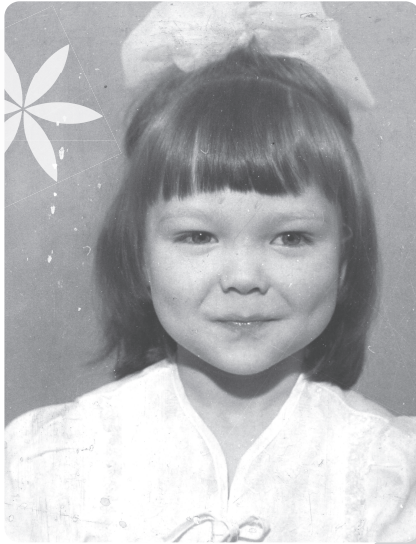
Als Kind war ich meist sehr ernst. Ich hatte so viele Fragen.

Güte entschieden und dies ihr Leben lang so beibehalten. Ganz gleich, wie unmenschlich sich manche in ihrem Umfeld auch benommen haben, sie hat nie ein böses Wort verloren, niemals jemanden bewertet. Ich glaube, das ist die wahre Engelsstärke: nicht zu bewerten, sondern in tiefster Güte Verständnis aufzubringen und liebevoll zu handeln. Eine solche Kraft in einem einzigen Menschen reicht für viele. Und sie zog sich, wenn ich heute zurückschaue, wie ein schmaler, aber spürbarer roter Faden durch die Jahre meiner Kindheit. Oder vielleicht sollte ich eher sagen: wie ein goldener Faden durch eine ansonsten recht düstere und schwere Welt.