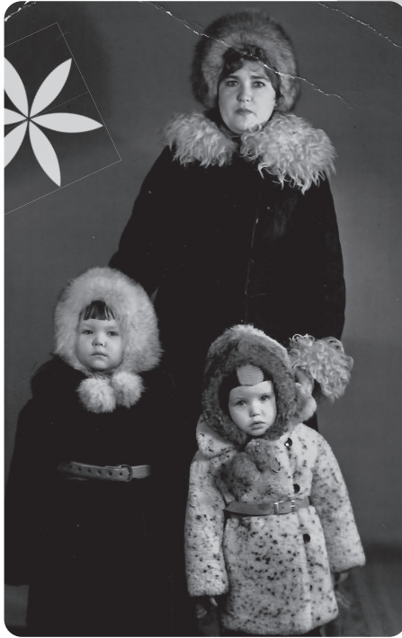
Mit meinem Bruder und meiner Mutter im Fotostudio – in dicker Winterkleidung.