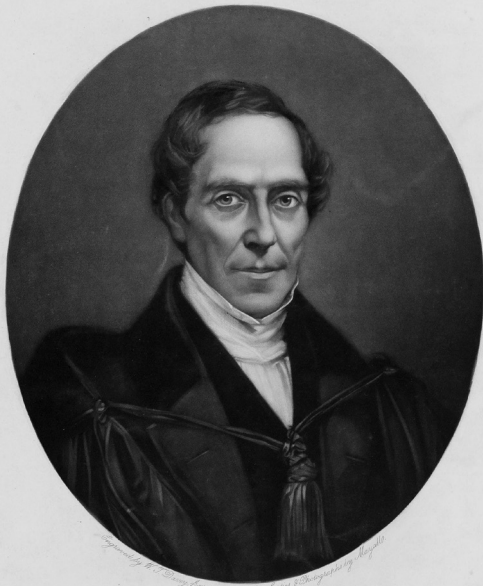
GIDEON ALGERNON MANTELL, L.L.D., F.R.S., &c.