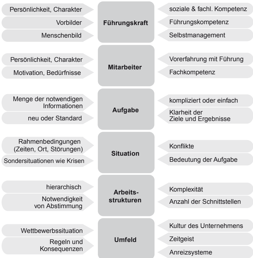
BILD 1.4 Einflussfaktoren auf die Führungssituation

Das wirkt sich auch auf seine Rolle als Führungskraft aus: Werte und was man unter Erfolg, Karriere, Sicherheit oder Wertschätzung versteht, steuern das Verhalten. Erfahrungen mit Führung, Leiten und der Übernahme von Verantwortung spielen ebenfalls eine Rolle. Vorbilder prägen, ob positiv oder negativ. Darüber hinaus beeinflussen Fähigkeiten im Bereich der sozialen Kompetenz und im Bereich der Selbstführung das eigene Handeln. Dies bedeutet: Jede Führungskraft wird ihre Aufgabe individuell interpretieren und im Verhalten andere Schwerpunkte setzen. Also prägen Sie und Ihre Persönlichkeit die Führungssituation.