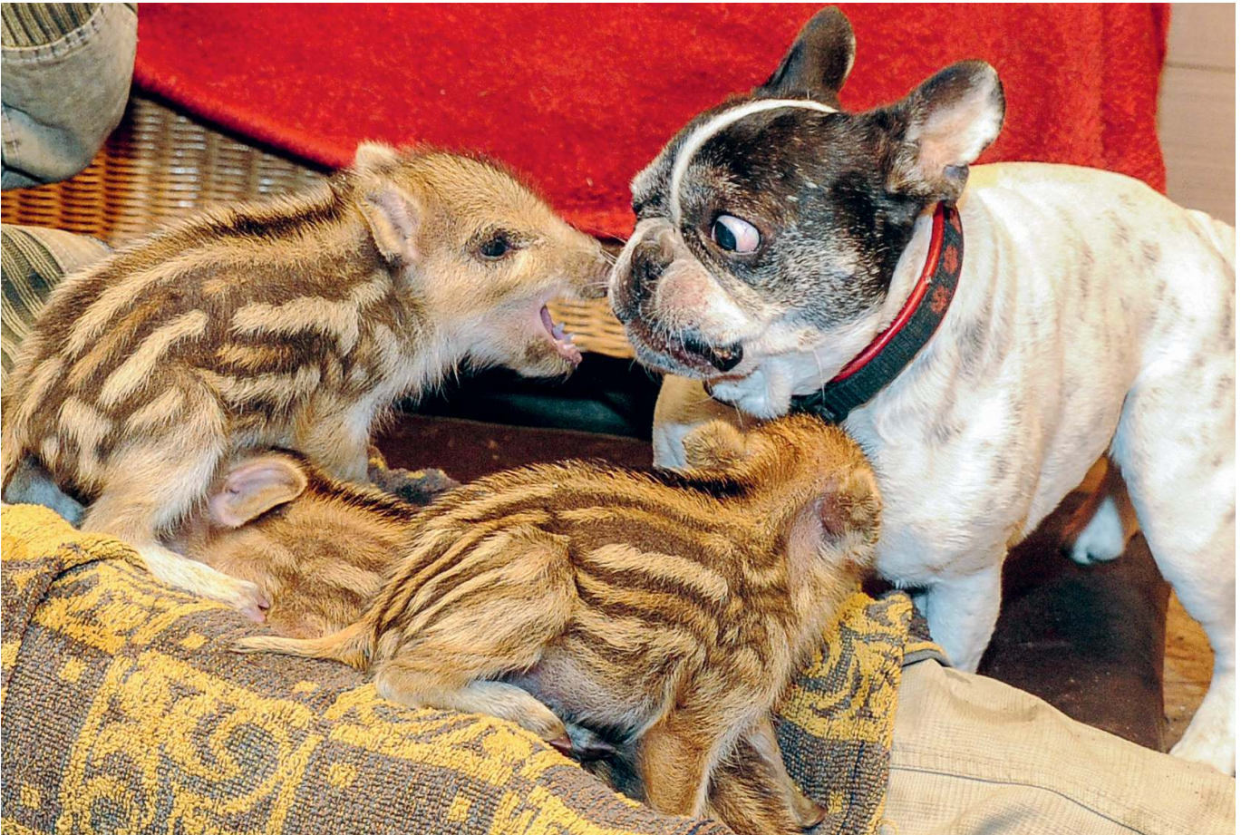
Schwein gehabt – Bulldogge Baby kümmert sich rührend um die verwaisten Frischlinge.