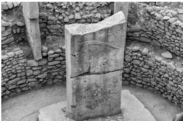
Eine von vielen Fuchsdarstellungen in Göbekli Tepe

Derartige Baukünste hatte man den Menschen der Altsteinzeit bis dahin nicht annähernd zugetraut. Doch damit nicht genug: Die steinzeitlichen Bauherren waren nicht nur Freunde monumentaler Architektur, sondern besaßen auch einen künstlerischen Anspruch, wie er andernorts erst Tausende Jahre später aufkommen sollte. Detaillierte Reliefs und selbst nahezu vollplastische Darstellungen verschiedener Tiere finden sich überall in der Anlage. Viele davon zeigen besonders große oder wehrhafte Arten, darunter Löwen, Schlangen, Wildschweine und Stiere. Das häufigste Säugetiermotiv ist jedoch ein zumindest auf den ersten Blick eher unscheinbarer Geselle. Realistisch dargestellt, mit spitzen Zähnen und buschigem Schwanz, begegneten den Ausgrabungsteams zahlreiche Darstellungen von Füchsen. 1 Der Fuchs, so vermuteten die Archäologen, musste im Glauben der altsteinzeitlichen Bewohner des »bauchigen Hügels« also eine wichtige Rolle gespielt haben.