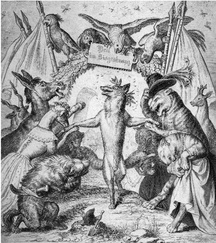
Illustration Wilhelm von Kaulbach: »Reineke Fuchs als Sieger«

auseinandersetzen muss. Ihre Geschichte beginnt damit, dass sie von einem Förster gefangen wird und auf dessen Hof aufwächst. Von Kindern geärgert und vom Hofhund bedrängt, gelingt ihr schließlich unter dramatischen Umständen die Flucht. Für einige Zeit kann sie ihr Leben in Freiheit genießen: Ein galanter Fuchsrüde macht ihr den Hof, die beiden gründen eine Familie, und sie lehrt ihre Welpen, was ein Fuchs zum Überleben in freier Wildbahn wissen muss. Doch es dauert nicht lange, bis Menschen – allen voran der gewiefte Landstreicher und Wilderer Háraschta –