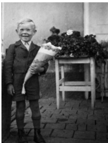
Erster Schultag, 1946, Uffing

Endlich kam das Jahr 1946, der strenge Winter war zwar noch nicht vorbei, aber die Situation schien sich ein wenig zu normalisieren. Es gab zwar immer noch nichts zu kaufen, aber das wenige einigermaßen organisiert. Der Schwarzmarkt feierte jeden Tag fröhliche Urständ, obwohl das natürlich verboten war; manchmal fuhren auch schon wieder Züge. Die waren derartig überfüllt, dass man sich das heute gar nicht mehr vorstellen kann. Die Leute saßen auf den Puffern, auf den Treppen zu den Bremserhäuschen, auf den Dächern oder hingen auf den außen an den Wagen angebrachten Trittbrettern und hielten sich an den Griffstangen fest. Aus den Städten kamen Leute aufs Land, um etwas zu hamstern.