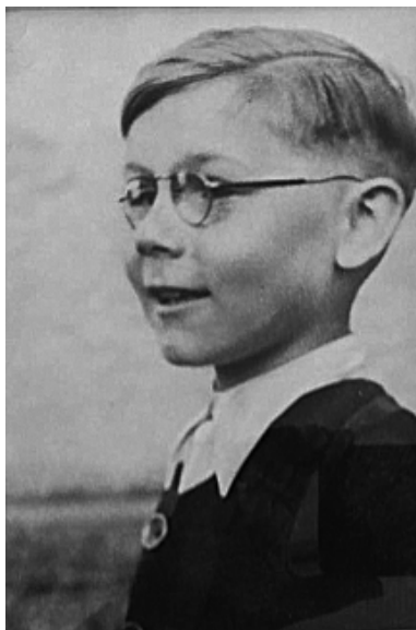
In Uffing, 1946

und hat das alles irgendwie hingekriegt. Wenn ich heutzutage das Wehklagen über alleinerziehende Mütter höre, denke ich immer an meine. Alleinerziehend war damals der Normalzustand, nicht nur für meine Mutter.