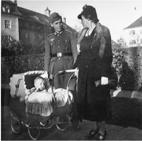
Mit den Eltern, 1940

das Café »Kessel« oder »Kessler« geheißen hat, weiß ich nicht mehr genau. Es lag jedenfalls an der schmalen Ostseite des Platzes, und es ging ein paar Stufen hinab ins Souterrain. Durch das Café sind wir dann in die Backstube gelangt. Aber da standen nur weiße Männer, alle sahen für mich gleich aus. Einer davon war mein Vater, erkannt habe ich ihn nicht. Ob er mich dann hochgenommen oder meine Mutter geküsst hat, keine Ahnung, haften geblieben ist nur das Bild der gleich aussehenden Männer. Übrigens war das das eine von nur insgesamt zwei Malen, dass ich meinen Vater gesehen habe.