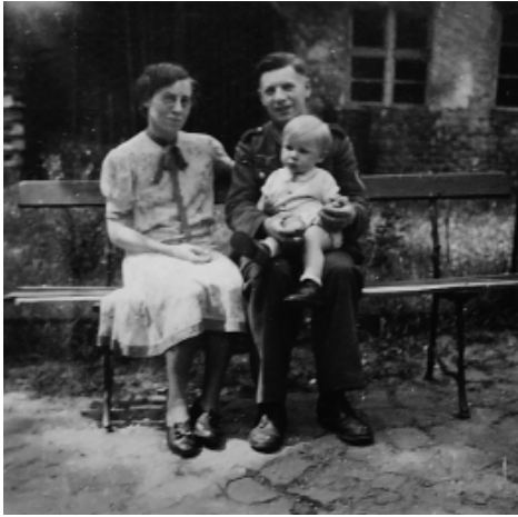
Mit Mama und Papa in Lauban im Garten der Großeltern

dass wir mittlerweile nicht allzu weit entfernt ebenfalls in Bayern gelandet waren, keine Ahnung. Vielleicht hat sie ihm ja einen Feldpostbrief geschrieben, Telefon gab es nicht bei uns. Jedenfalls hat sich mein Vater auf ein Fahrrad gesetzt und ist in der Nacht zu uns nach Uffing geradelt. Am nächsten Morgen war er da, er wollte wohl sehen, wie es seiner Familie ging, musste aber schnell wieder zurück in die Kaserne. Die Rückfahrt wollte er mit dem Zug machen.