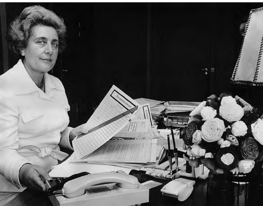
Die Parlamentarische Staatssekretärin im Bundeskanzleramt Marie Schlei (SPD), 1974