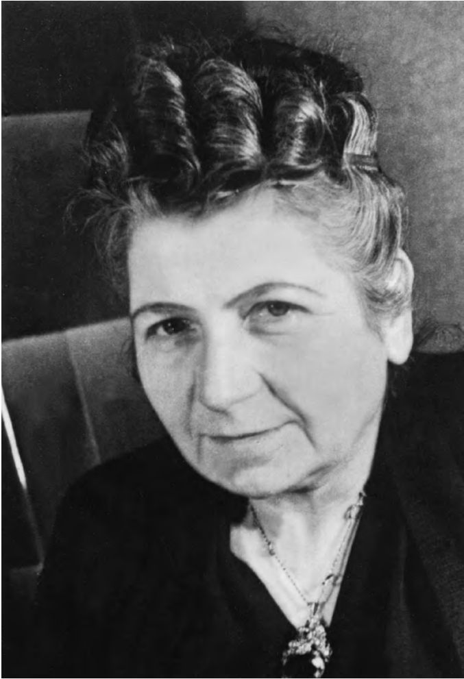
Jeannette Wolff (SPD), Mitglied des Deutschen Bundestags 1952–1962 und Mitbegründerin der Arbeiterwohlfahrt