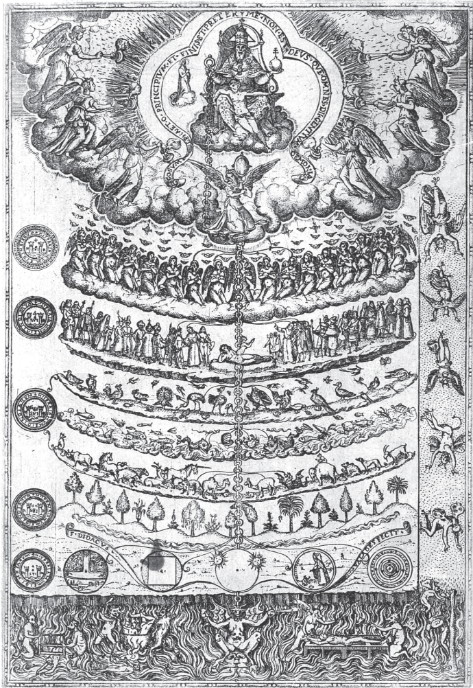
Diese Illustration aus dem 16. Jahrhundert zeigt die Natur als eine unveränderliche »Große Kette des Seins«, aufsteigend von Erde und Gestein über die Pflanzen und Tiere bis zum Menschen. Darstellungen von Himmel und Hölle rahmen die Szene oben und unten ein. (Diego Valadés: Rhetorica Christiana (1579), Getty Research Institute)