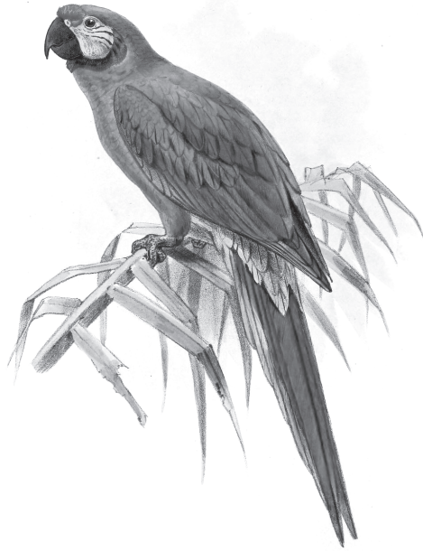
Der Große Soldatenara (auch Bechsteinara oder Grüner Ara) ist der größte mittelamerikanische Papagei – seine Beziehung zum Almendro ist nun in Gefahr. (P. W. M. Trap, Onze Vogels in Huis en Tuin (1869), Biodiversity Heritage Library)

so überraschen dürfen. Schließlich ist Veränderung der Herzschlag der Evolution. Das Wort stammt vom lateinischen evolvere (entrollen, auswickeln), und jeder Organismus ist das Produkt dieser beständigen Bewegung. Spezies beginnen zu existieren, passen sich an, lassen dabei häufig Neues entstehen und gehen schließlich wieder unter, wenn die Welt um sie herum sich verändert. Selbst wenn die Almen-dros nicht bis in die Vorgebirge gelangten und verschwänden, wäre das ganz normal: Aussterben ist das Schicksal aller Lebewesen. Obwohl ich das wusste, wurde mir bei dem Gedanken, dass es meine riesigen Forschungsobjekte (manche mit einem Stammumfang von