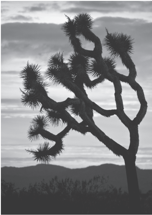
Die Josua-Palmlilie ist die weltweit größte Art ihrer Gattung ( Yucca ). Sie kommt ausschließlich in der Mojave-Wüste vor, die sich durch die Klimaerwärmung rasch verändert.

mawandel vorgestellt und unterzeichnet wurde. Etwas Neues war das nicht – schon im 19. Jahrhundert hatte die Wissenschaft den Einfluss von Kohlendioxid-Emissionen vorausgesehen, und die Formulierung »Erderwärmung« war im Bereich des Umweltschutzes seit Jahren geläufig. Diese Konferenz markierte allerdings insofern einen Wendepunkt, als sie den Klimawandel von einem rein wissenschaftlichen Thema zu einem öffentlichen und globalen Problem machte. In den Folgejahren gerieten die immer eindeutigeren Beweise und die