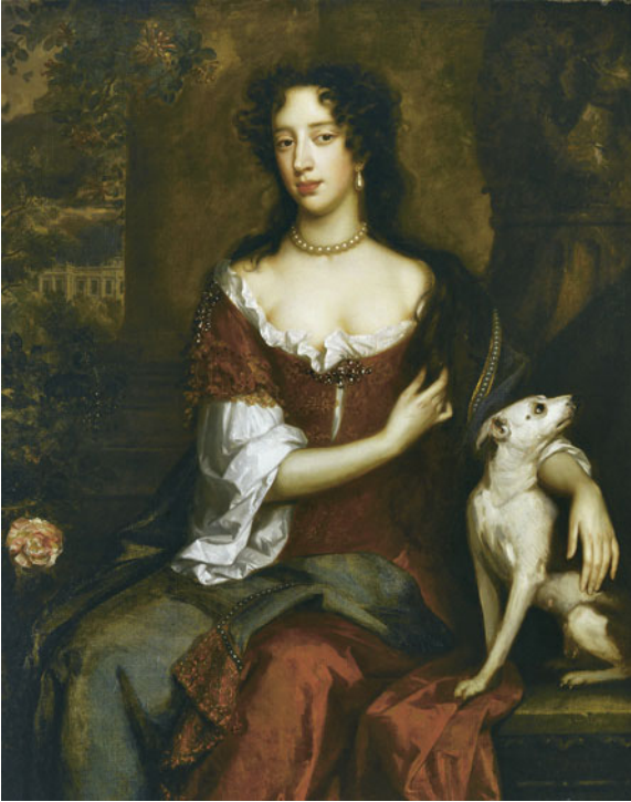
Jakob II. von England und seine 25 Jahre jüngere zweite Frau Maria Beatrix d'Este, Prinzessin von Modena, die ihm 1688 den langersehnten katholi-