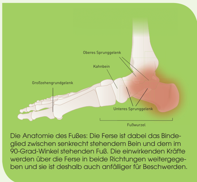
Die Anatomie des Fußes: Die Ferse ist dabei das Bindeglied zwischen senkrecht stehendem Bein und dem im 90-Grad-Winkel stehenden Fuß. Die einwirkenden Kräfte werden über die Ferse in beide Richtungen weitergegeben und sie ist deshalb auch anfälliger für Beschwerden.

Es gibt aber noch andere Bilder, die im Zusammenhang mit der Ferse auftauchen. Zum Beispiel das eines trotzigen Kindes, das nicht bekommt, was es will, und darum fest mit der Ferse auf den Boden stampft. Andere denken sofort an Militär und Gehorsam – daran, die Hacken zusammenzuknallen. Wir geben Fersengeld, wenn wir uns davonmachen, oder stehen mit beiden Füßen fest im Leben (womit wir wieder beim