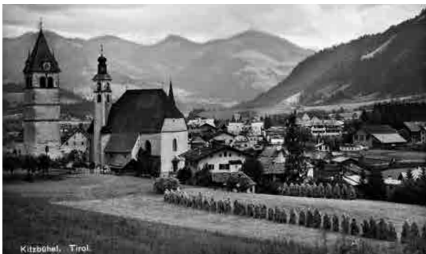
In Aufschnaiters Jugend war Kitzbühel eine verarmte Bergarbeiterstadt.