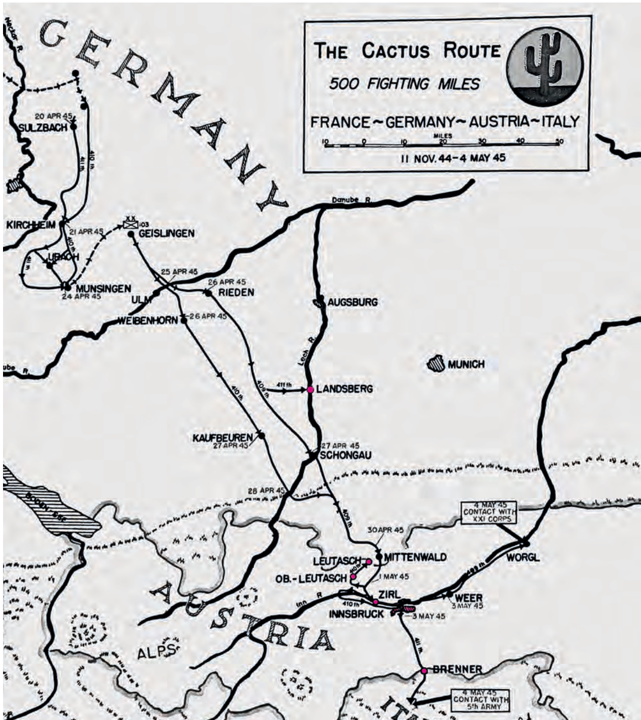
Die Route der 103rd Infantry Division (Cactus Division) vom 20. April bis 4. Mai 1945.