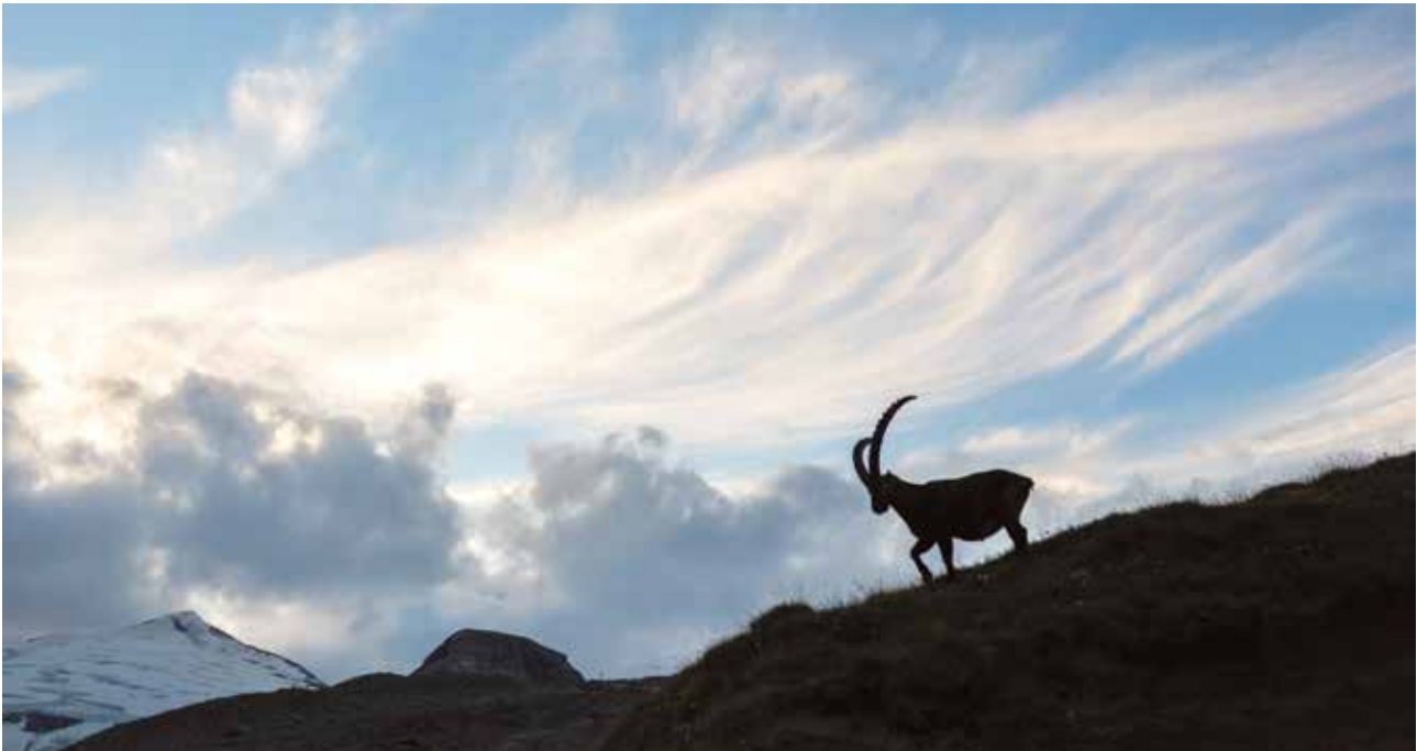
■ Stunning wildlife in a stunning setting.

Ein beeindruckendes Wildtier in einer beeindruckenden Umwelt.