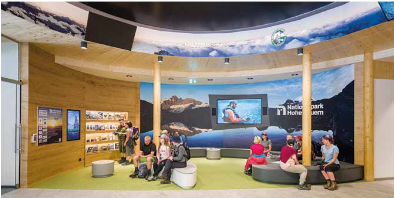
■ View of the spaciously appointed entrance area.