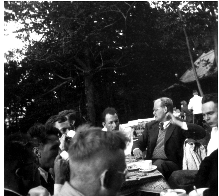
Ausflug nach Misdroy (Insel Wollin) im Sommer 1936

An Karl Barth (1886–1968) schrieb Dietrich Bonhoeffer: „Die Arbeit im Seminar macht mir Freude. Wissenschaftliche und praktische Arbeit sind schön miteinander verbunden. [...] Dass aber sowohl theologische Arbeit wie auch wirkliche seelsorgerliche Gemeinschaft nur erwachsen kann in einem Leben, das durch morgendliche und abendliche Sammlung um das Wort, durch feste Gebetszeit bestimmt ist, ist gewiss ...“ 8