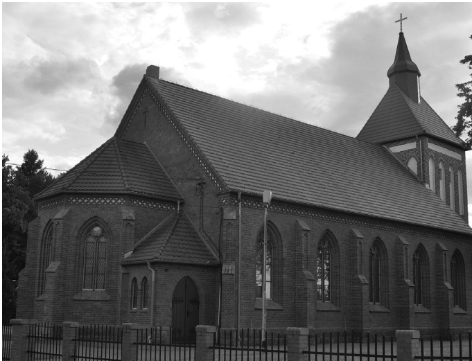
Dorfkirche in Groß Schlönwitz

Nach der Schließung des Seminars in Finkenwalde richtete Bonhoeffer ab Ende 1937 in verschiedenen Orten Hinterpommerns Sammelvikariate ein. Man suchte Gemeinden, deren Pfarrer der Bekennenden Kirche gewogen waren und unterstellte ihnen mehrere Lehrvikare. Die