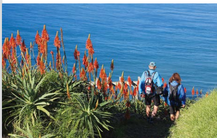
Abstieg nach Paul do Mar.

völkerten Surfbarm Maktub gibt es eine kleine Mole, von der man bei ruhiger See ins Meer steigen kann, oft ist das Meer hier allerdings den Wellenreitern vorbehalten. Kurz nach dem Szenetreff wird am Aparthotel Paul do Mar ③