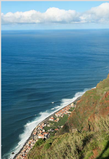
Tiefblick auf Paul do Mar.

die Rua Prof. Francisco Barreto über. Von links mündet die Rua das Eirinhas ein, wir gehen weiter geradeaus. Immer auf dem Teerweg bleibend wird eine halbe Stunde nach der Kirche schließlich die Levada Nova 5 , 640 m, erreicht. Wir folgen dem schmalen Wasserkanal rechts entgegen der Fließrichtung. Die Levada schlängelt sich durch zwei Täler, Kulturland wechselt mit Kiefernwald und Farnwiesen. Nach einer gemütlichen Dreiviertelstunde auf der Levada verschwindet diese unter einer Teerstraße. Wir gehen 6 m links die Straße aufwärts und treffen wieder auf den Kanal. 20 Minuten darauf wird in Raposeira do Lugarinho 6 eine Straße erreicht (links befindet sich eine Bar mit zugehörigem Tante-Emma-Laden). Die Levada läuft hier durch einen Privatgarten. Wir folgen der Straße rechts für