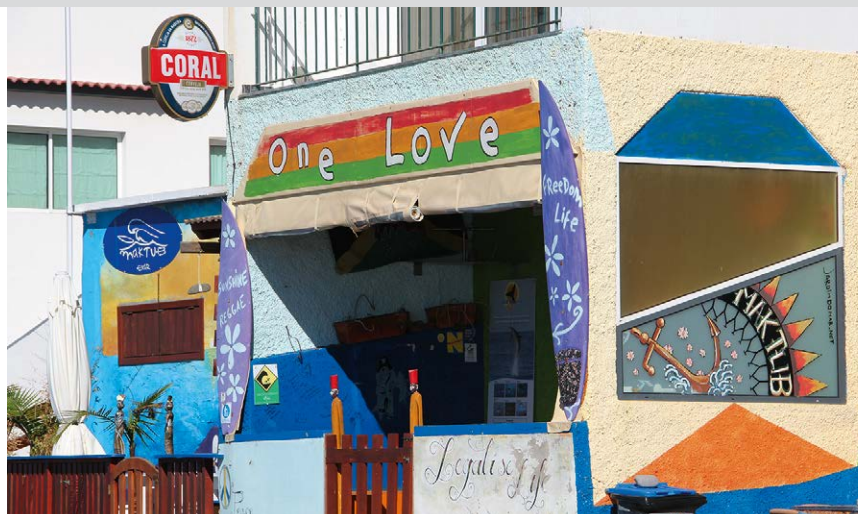
Szenetreff in Paul do Mar.

vor einer kleinen Brücke die Uferstraße rechts in die gepflasterte Vereda dos Zimbreiros verlassen. Nach 75 m queren wir auf einer Bogenbrücke die Ribeira das Galinhas. Der Weg führt zwischen zwei Häusern hindurch. Es folgt nun ein langer steiler Aufstieg durch eine anspruchslose Küstenflora mit Opuntien und Agaven. Am Aussichtspunkt , 314 m, an dem alten Förderband bietet sich eine Atempause an, hier fällt das Kap senkrecht zum Meer ab.