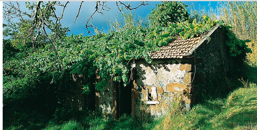
Was der Mensch aufgegeben hat, holt sich die Natur Stück für Stück zurück – an der Levada Nova.

die Rua Prof. Francisco Barreto über. Von links mündet die Rua das Eirinhas ein, wir gehen weiter geradeaus. Immer auf dem Teerweg bleibend wird eine halbe Stunde nach der Kirche schließlich die Levada Nova 5 , 640 m, erreicht. Wir folgen dem schmalen Wasserkanal rechts entgegen der Fließrichtung. Die Levada schlängelt sich durch zwei Täler, Kulturland wechselt mit Kiefernwald und Farnwiesen. Nach einer gemütlichen Dreiviertelstunde auf der Levada verschwindet diese unter einer Teerstraße. Wir gehen 6 m links die Straße aufwärts und treffen wieder auf den Kanal. 20 Minuten darauf wird in Raposeira do Lugarinho 6 eine Straße erreicht (links befindet sich eine Bar mit zugehörigem Tante-Emma-Laden). Die Levada läuft hier durch einen Privatgarten. Wir folgen der Straße rechts für