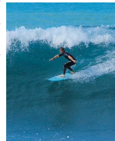
Wellenreiter vor Paul do Mar.

10 m und umgehen dann das Haus mit dem Garten. Knapp 10 Minuten nach Raposeira quert die Levada die alte Landstraße und schwenkt ins Tal der Ribeira da Cova. In Maloeira werden kurz hintereinander zwei Straßen gekreuzt (auf der zweiten Straße kann zur 100 m entfernten Snackbar Moinho abgestiegen werden). 20 Minuten später kommen wir an einem allein stehenden Wasserhaus vorbei. Die Levada läuft nochmals in ein Tal hinein. Gut 10 Minuten nach dem Wasserhaus verschwindet sie in Höhe des Caminho Lombo da Velha für 20 m unter einer Straße. Knapp 10 Minuten darauf wird schließlich an zwei Picknicktischen am Posto Florestal in Prazeres 7 die Levada in das Sträßchen nach rechts verlassen, auf dem in 2 Minuten zur Hauptstraße von Prazeres abgestiegen wird (50 m rechts von der Kreuzung ist eine Bushaltestelle). Für den Rückweg zum Hotel Jardim Atlântico kreuzt man die Hauptstraße und folgt dem Caminho Lombo da Rocha abwärts. An der Kreuzung an der Kirche (Einkehr dahinter im Teehaus der Quinta Pedagógica) hält man sich rechts in Richtung Hotel, an der Gabelung 4 Minuten darauf geht man ebenfalls rechts. Das Sträßchen führt am Restaurant Olhar do Campo vorbei und schwenkt am Restaurant Saloio nach rechts zum Hotel Jardim Atlântico 1 .