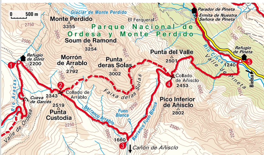
Abstieg ins Valle de Pineta.

steil in die Schlucht abgestiegen und an der Quelle Fuen Blanca, 1704 m, vorbeigegangen sind, erreichen wir das Ende des Cañón de Añisclo (arag. Balliñiscló), des längsten Taleinschnitts des Nationalparks. Wir überqueren den Río Bellós (3) , 1660 m, über eine Planke und steigen auf der anderen Seite über grasbewachsene Terrassen wieder aus dem Tal hinaus. Am Collado de Añisclo (4) , 2453 m, treffen sich beide Varianten des GR 11 wieder. Nun liegt einer der anstrengendsten Abstiege des GR 11 vor uns: Auf rund 4 km Strecke geht es 1200 Hm in die Tiefe. So erreichen wir den Talgrund des Valle de Pineta mit dem Refugio de Pineta (5) , 1240 m, jenseits des meist trockenen Flussbetts. Nach Nordwesten hin weitet sich das Tal zu einem imposanten Felskessel.