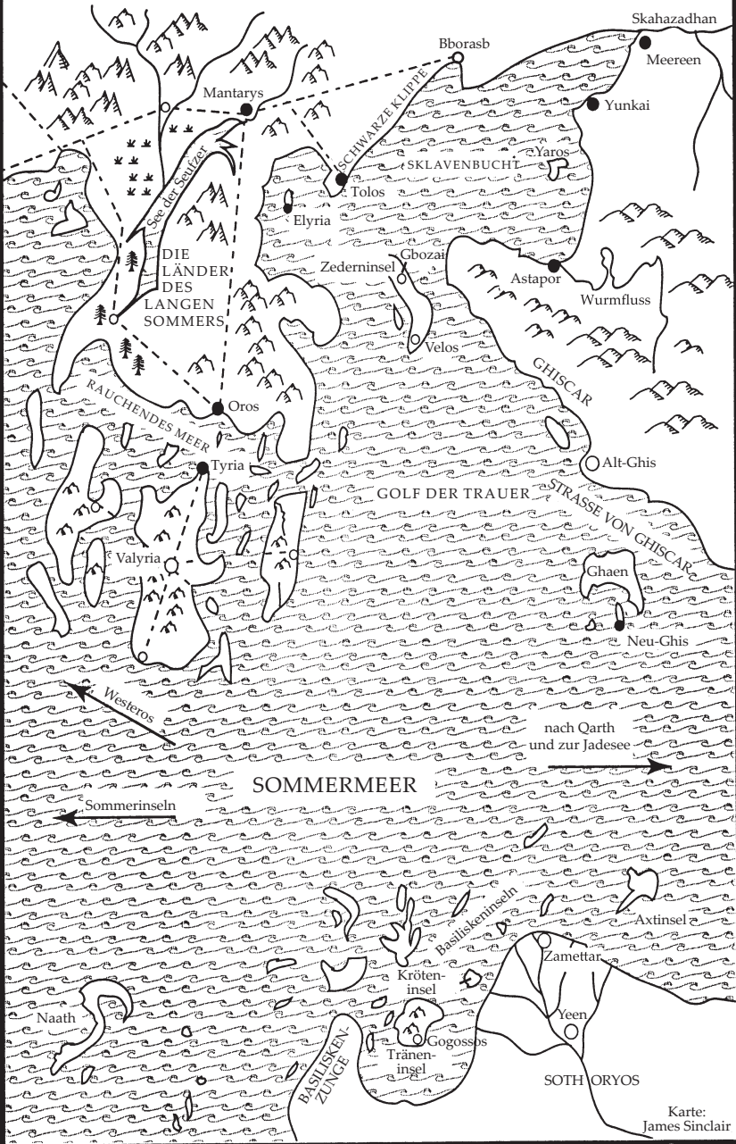
Karte: James Sinclair