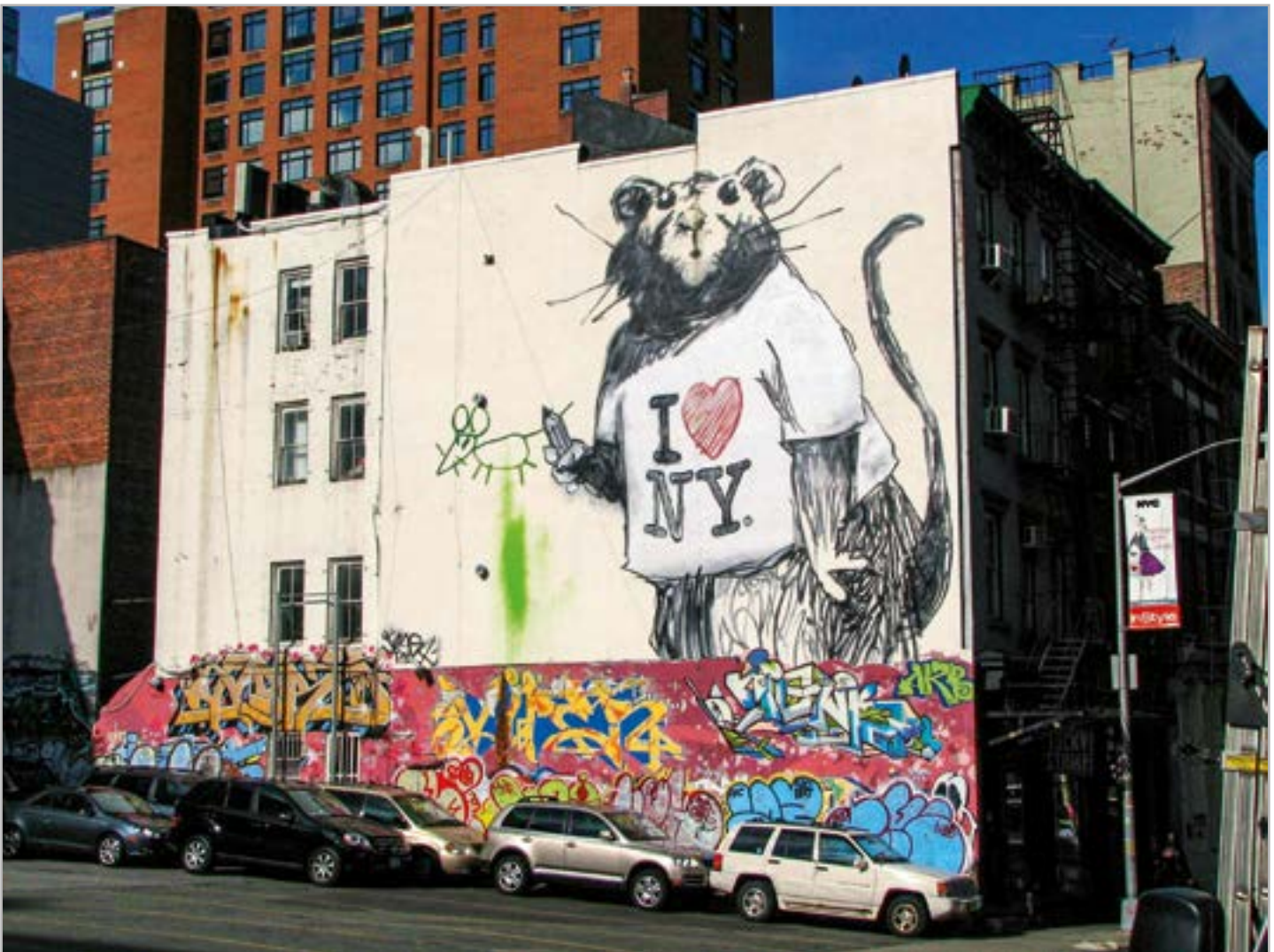
50 und 51 I love New York. Wie wir alle? Großes Wandbild einer Ratte, die das berühmte T-Shirt trägt, an einer Wand an der Ecke von Wooster Street und Grand Street in New York City.