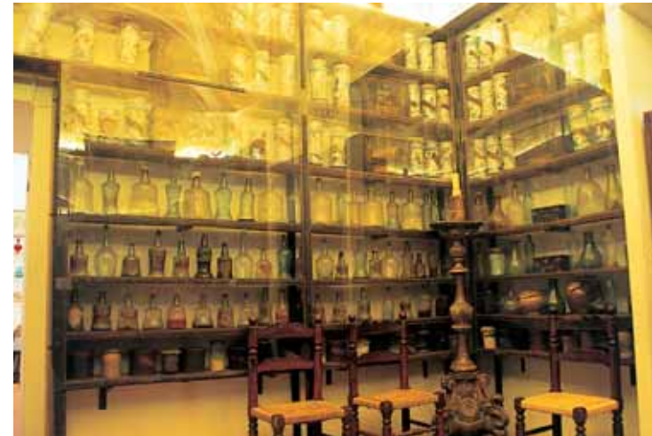
Die Klosterapotheke in Valldemossa ist nicht mehr in Betrieb – sie zeigt uns, wie eine solche Einrichtung vor über hundert Jahren aussah.

ken gekommen, ans Meer zu ziehen – abgesehen davon, daß sie dort gar kein Haus gefunden hätten. Die Mallorquiner selbst nämlich hielten sich fern vom Meer, das ihnen nur Unheil in Gestalt von Eroberern und Piraten gebracht hatte. Das erklärt auch, daß sie, als die ersten Touristen und Investoren kamen, diesen bereitwillig (und kopfschüttelnd) die in ihren Augen wertlose Küste überließen. Acker- und Obstland war schließlich seit Jahrhunderten das Kapital der Bauern und der Großgrundbesitzer – nur Palma war durch das Meer reich geworden, mit Schifffahrt und Handel. Wer kein Land erbte, war ein armer Hund, mußte sich als Knecht oder Matrose verdingen, ins Kloster gehen oder auswandern. Mit dem Fremdenverkehr änderte sich alles – plötzlich war der Dumme, wer sich in der Landwirtschaft abmühte. Die anderen machten an der Küste als Kellner Karriere, besaßen bald Läden, Bars und Restaurants, aus Andenkenverkäufern wurden