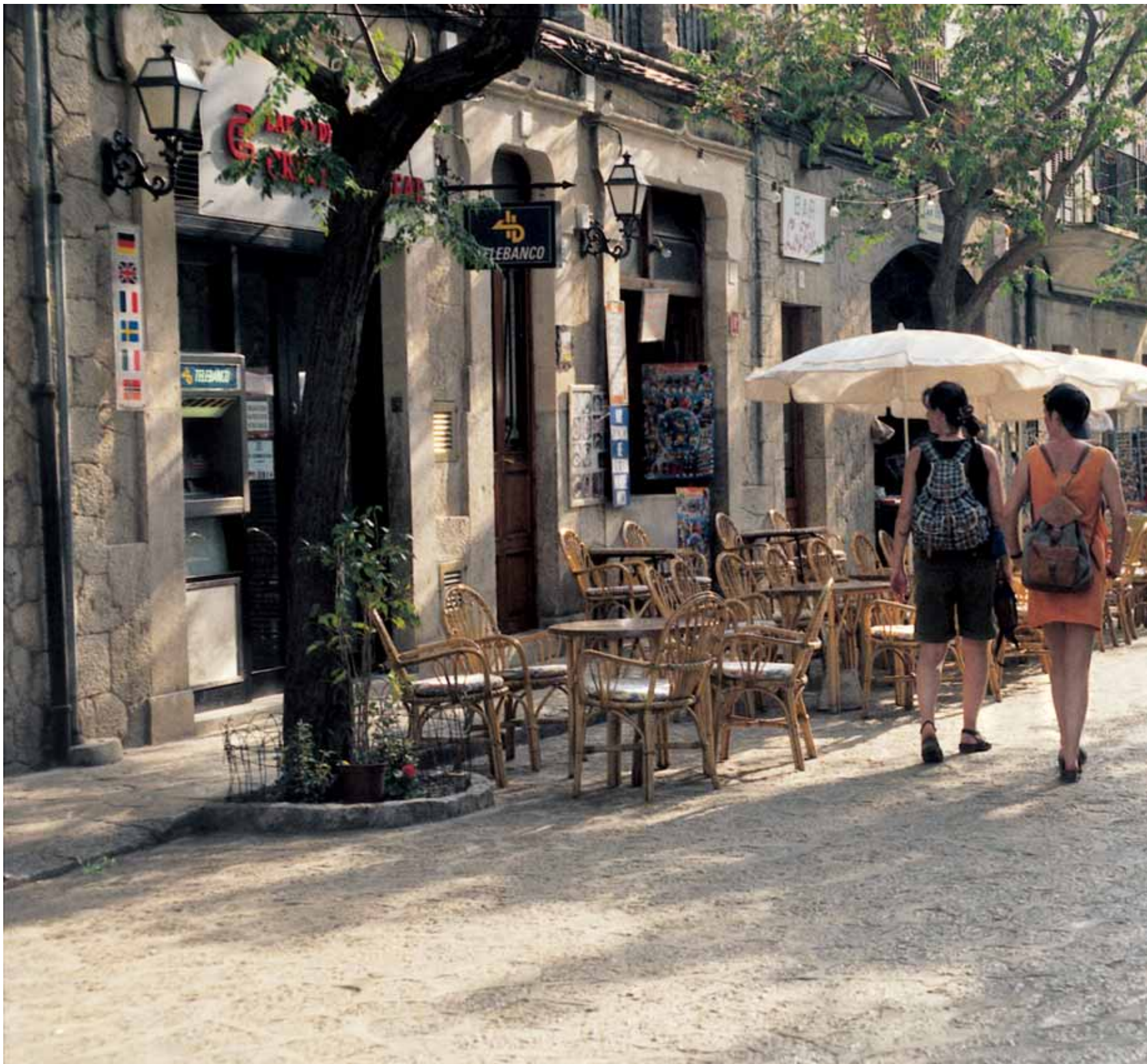
Abends kehrt Rube ein im tagsüber von Touristen überfluteten Valldemossa. Katalanische Strenge verbindet sich hier mit provenzalisch anmutendem Charme.