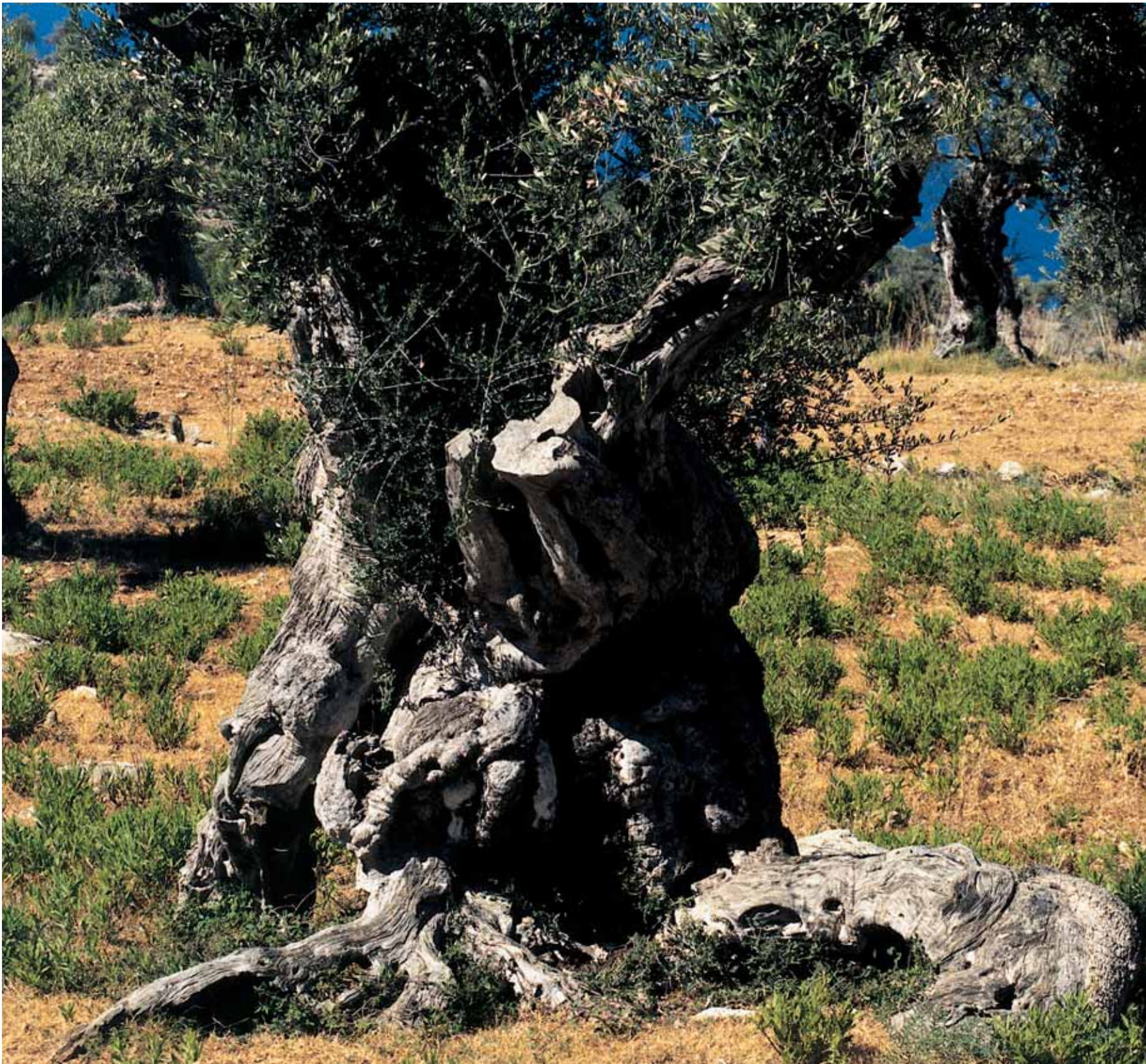
An uralten, charaktervollen Oliven- und Johannisbrotbäumen vorbei strampeln Profis und Amateure: Mallorcas Klima und die guten Straßen werden hoch geschätzt.