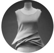
Stachelig B 47 ..... 71