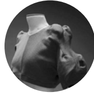
Linien und Kurven A 60 ..... 89