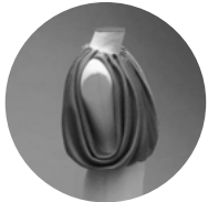
Rundumdrapierung 55 ..... 80