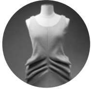
Stachelig C 48 ..... 72