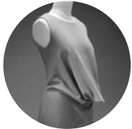
Vorspringende Kante 54 ..... 78