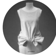
Schlupfloch A 58 ..... 84