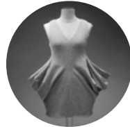
Rochen 64 ..... 96