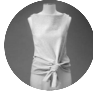
Schlupfloch B 58 ..... 86