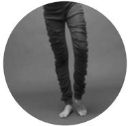
Apfelschale B 52 ..... 76