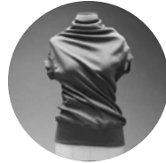
Stopper 56 ..... 82