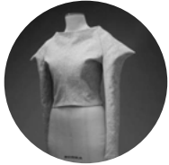
Stachelig D 49 ..... 74