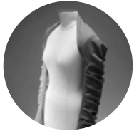
Apfelschale A 50 ..... 75