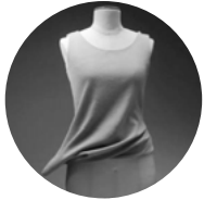
Stachelig A 46 ..... 70