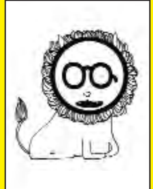
Peter and Paul