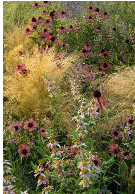
Oben: Ein gelungenes Dreigespann sind Purpur-Scheinsonnenhut, Punktierte Indianernessel und duftiges Reihergras. Die unterschiedlichen Wuchs- und Blütenformen sorgen für Spannung, die Farben für Harmonie.