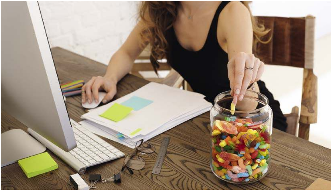
Ungesunder Arbeitsalltag: Wenig Bewegung, viel Sitzen und immer wieder snacken oder naschen.

Um aber gesund und leistungsfähig zu bleiben, brauchen wir einen Ernährungsmix aus lebensnotwendigen Substanzen, wie Eiweiß, guten Fetten, Ballaststoffen und wenig Kohlenhydraten sowie Vitaminen, Mineralstoffen, Spurenelementen und bioaktiven Pflanzenstoffen. Stimmt die Balance zwischen den Nährstoffen nicht – wie es bei vielen Fertiggerichten, Fastfood-Gerichten oder Billiglebensmitteln und einer unausgewogenen Ernährungsweise der Fall ist –, macht auch der vitalste Stoffwechsel irgendwann schlapp. Und das im wahrsten Sinne des Wortes: Viele Patienten berichten mir von Müdigkeit und Schwäche. Mit einer passgenauen Ernährung anhand des 20:80-Prin-