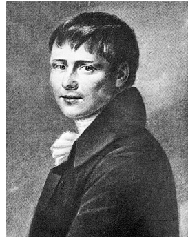
Heinrich v. Kleist (1777–1811) ist für seine Anekdoten, z. B. die „Anekdote aus dem letzten preussischen Kriege“ (1810), bekannt.