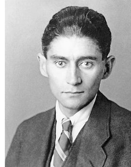
Franz Kafka (1883–1924)

Früher hatten Parabeln einen lehrhaften Zug, der zu ethisch-sittlichem Verhalten aufforderte (Toleranz, Nächstenliebe). Typisch sind z. B. die Parabeln aus dem Neuen Testament (Gleichnis vom verlorenen Sohn). Diese lehrhafte Tendenz kommt bei modernen Parabeln seltener vor. Moderne Parabeln sind verrätselt und mehrdeutig . Bild- und Sachebene gehen ineinander über. Bei den Parabeln von Franz Kafka beispielsweise wird die Verrätselung in der Regel nicht aufgelöst und der Leser bleibt oft ratlos zurück.