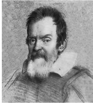
Galileo Galilei (1564–1642)

Die Gestaltung der dramatischen Hauptfigur des Stückes basiert auf der historischen Person Galileo Galilei. Der italienische Mathematiker, Philosoph und Physiker gilt aufgrund der Einführung des quantitativen Experiments als Begründer der modernen Naturwissenschaft. Seine astronomischen Forschungen weisen die Theorie des heliozentri-