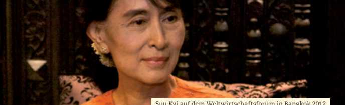
Suu Kyi auf dem Weltwirtschaftsforum in Bangkok 2012