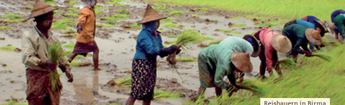
Reisbauern in Birma

Sie, die nie zuvor öffentlich geredet hatte, sprach plötzlich an der Shwedagon Pagode der Hauptstadt Rangun zu Hunderttausenden, die gebannt zuhörten und ihr hoffnungsvoll zujubelten. Ein anderes Birma schien möglich. Auf unermüdlichen Wahlkampftouren zu ethnischen Minderheiten in schwer zugänglichen Regionen gewann sie die Herzen der Birmanen – der Demokratiebewegung strömten die Anhänger in Scharen zu. Das Regime bekam kalte Füße. Und ließ 1989 die gesamte Führungsspitze der NLD ins Gefängnis werfen; Suu Kyi wurde unter Hausarrest gestellt.