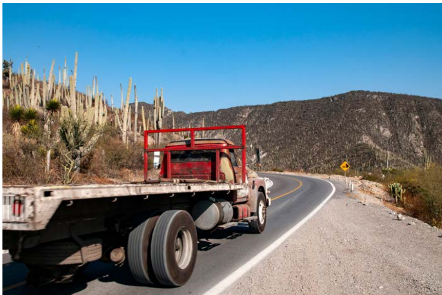
Nikon D300, 22 mm, 1/400 s, f/8, ISO 400