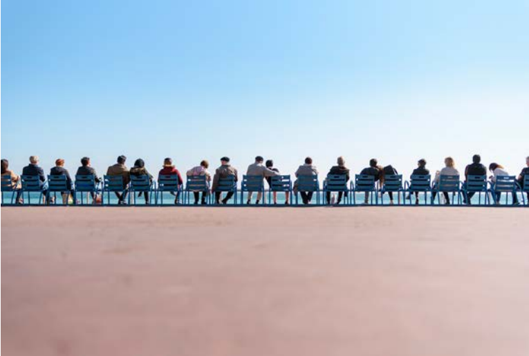
Nikon D750, 35 mm, 1/4.000 s, f/1.8, ISO 50