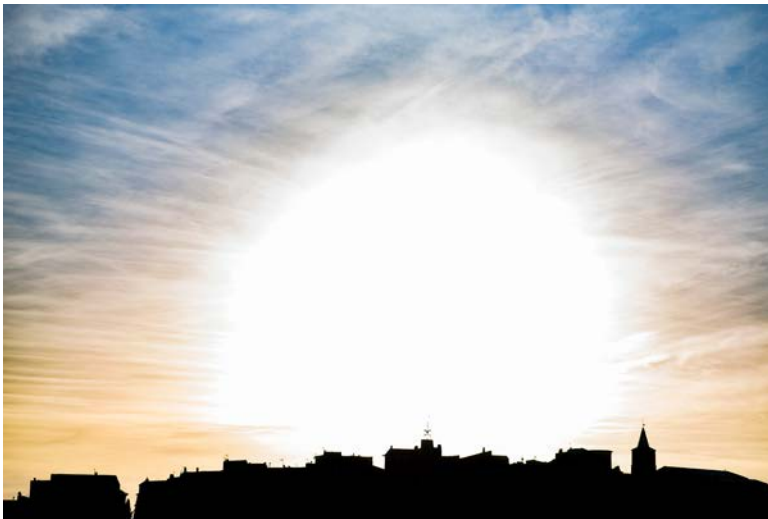
Nikon D750, 300 mm, 1/640 s, f/8, ISO 125

Meine fotografische Entwicklung ist nicht in geraden Bahnen verlaufen. Gerade in der Anfangszeit habe ich viele unterschiedliche Motive und Methoden ausprobiert, aber insgesamt ging jede Phase ganz logisch und automatisch in die nächste über. Meiner Meinung nach muss man sich nur selbst immer treu bleiben.