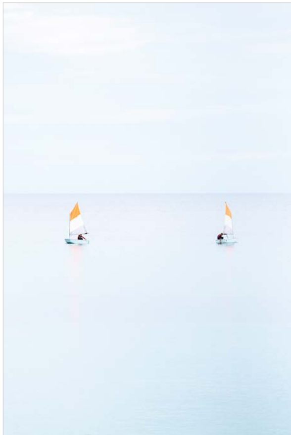
Nikon D750, 150 mm, 1/1.000 s, f/32.8, ISO 800