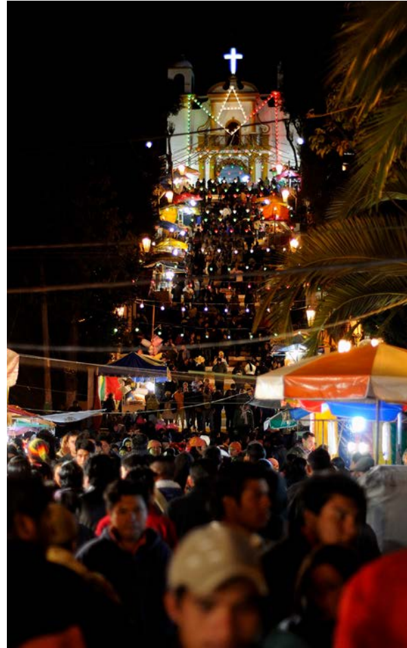
Nikon D300, 50 mm, 1/80 s, f/2.8, ISO 800