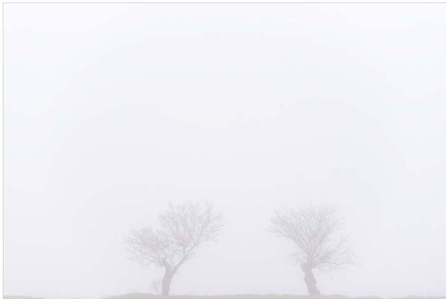
Nikon D750, 150 mm, 1/640 s, f/5,6, ISO 100