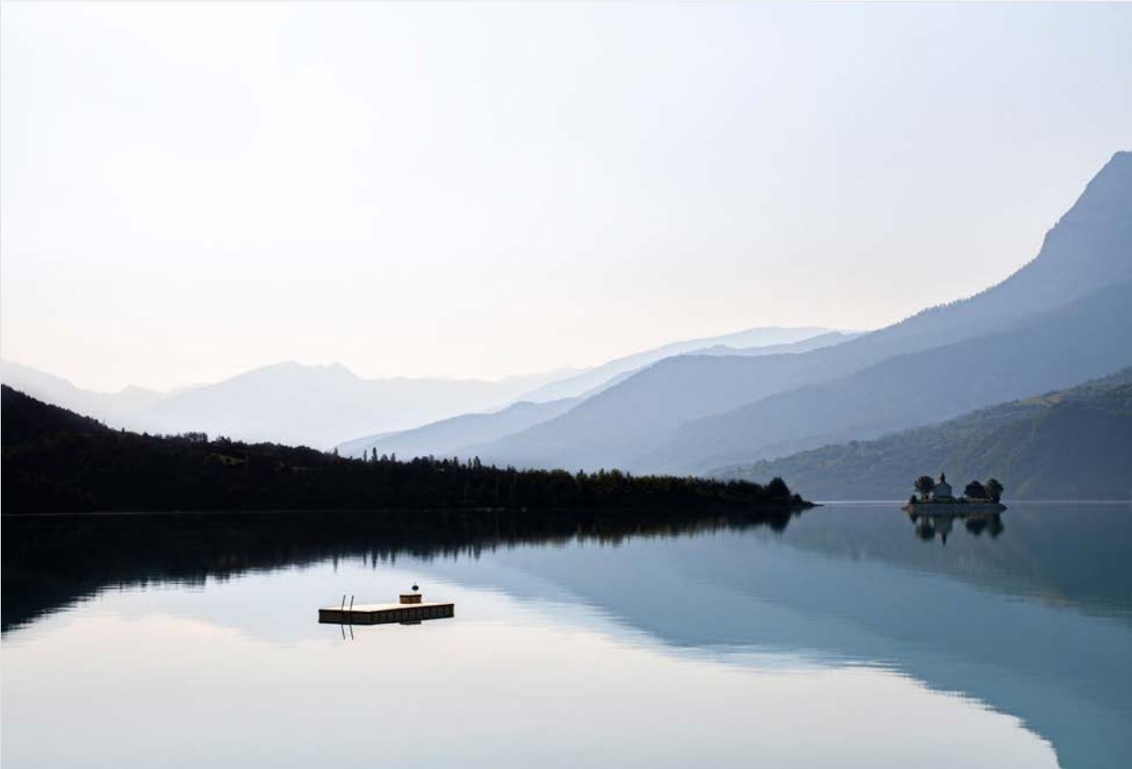
Nikon D750, 85 mm, 1/4.000 s, f/2, ISO 100