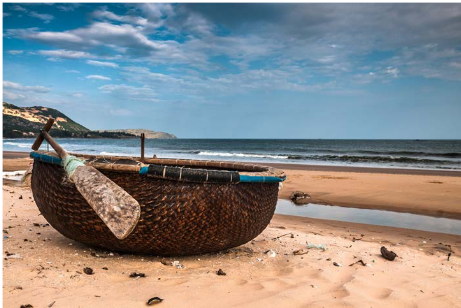
Nikon D300, 24 mm, 1/200 s, f/8, ISO 100