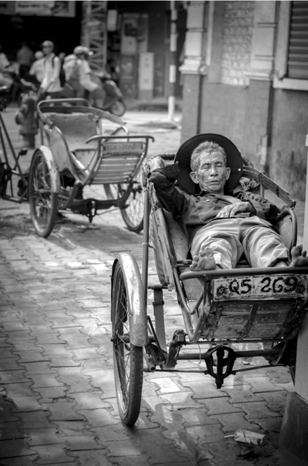
Nikon D300, 50 mm, 1/200 s, f/2.8, ISO 200