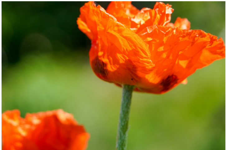
Abbildung 9.10: Diese Blüte konnte mit der voll geöffneten Blende f2,8 (oben) wesentlich harmonischer vor dem Hintergrund freigestellt werden, als dies mit Blende f5,6 (unten) möglich ist.

Für das Spiel mit der Schärfe und Unschärfe sind also besonders lichtstarke Objektive notwendig. Das Kit-Objektiv, das erst bei Blende f3,5 bzw. f5,6 beginnt, lässt aber auch bereits erste Experimente zu.