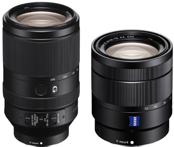
Abbildung 9.7: Erste Wahl, wenn es um Zoomobjektive geht: das Zeiss Vario-Tessar T* E 16–70 mm F4 ZA OSS . Für ein Zoomobjektiv können Sie hier wirklich überdurchschnittliche Leistungen erwarten (Foto: Sony).

Abbildung 9.6: Das Sony FE 70–300 mm F4,5–5,6 G OSS ist für den Telebereich zu empfehlen. Allerdings schlägt es gleich mit ca. 1600 Euro zu Buche.