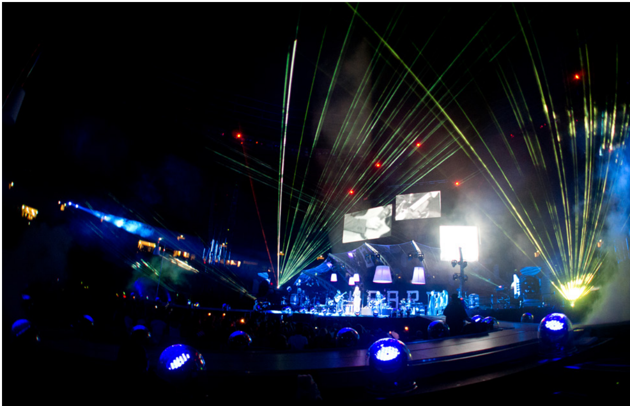
Abbildung 9.8: Bei diesem Konzert stand wenig Licht zur Verfügung. Dank der hohen Lichtstärke des Objektivs konnte die Szene freihändig bei 1/10 s unverwackelt aufgenommen werden. 16 mm | f2,8 | 1/10 s | ISO 1600

Damit ergibt sich der Vorteil, dass auch bei wenig Licht, z. B. in Räumen, ein Arbeiten ohne Stativ und Blitz möglich wird. Dies ist gerade dann ein unschätzbare Vorteil, wenn das Blitzen verboten ist, z. B. in Kirchen, oder wenn dies andere Leute stören könnte, z. B. im Theater. Stellen Sie an Ihrer \alpha 6100 das Programm A ein und wählen Sie einen möglichst kleinen Blendenwert. Außerdem stellen Sie den ISO-Wert z. B. auf ISO 800 ein. Die Belichtungszeit sollte nun so kurz sein, dass Unschärfe durch Verwackeln bei der Arbeit aus der Hand vermieden wird.