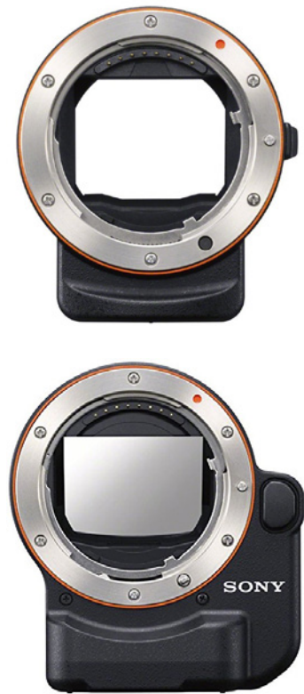
Abbildung 9.12: Oben: LA-EA3, unten: LA-EA4 mit Autofokus-System

Um mit der α6100 alle üblichen Motive in ordentlicher Qualität aufnehmen zu können, sind als Minimum zwei bis drei Objektive zu sehen. Das wären ein Weitwinkel- und ein Telezoom sowie eventuell noch ein Objektiv für den Makrobereich. In jedem Fall gilt der Grundsatz: Die beste Kamera ist nur so gut wie das Objektiv.