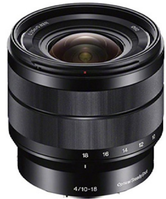
Abbildung 9.13: Sonys Weitwinkel-Zoomobjektiv E 10–18 mm F4 OSS

Dieses Weitwinkel-Zoomobjektiv, das speziell für Kameras mit APS-C-Sensor entwickelt wurde, gibt an Ihrer \alpha 6100 eine Bildwirkung wieder, die einem 15–27-mm-Objektiv im Kleinbildformat entsprechen würde. Hiermit gelangen Sie also in den extremen Weitwinkelbereich, was z. B. auch extreme Perspektiven erlaubt. Für optimale Schärfe bis in die Ecken blenden Sie etwa ein bis zwei Blenden ab. Konstruktionsbedingt müssen Sie in diesem Brennweitenbereich mit Verzeichnungen rechnen. Die Naheinstellgrenze von 25 cm erlaubt Ihnen, dicht an die Motive heranzugehen, was interessante perspektivische Effekte möglich macht. Der Autofokus-Motor ist sehr leise und damit das Objektiv auch zum Filmen geeignet.