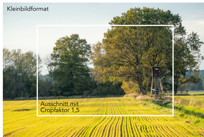
Abbildung 9.3: Mit der \alpha 6100 erhalten Sie gegenüber einem Dia oder Negativ im klassischen Kleinbildformat einen um den Faktor 1,5 verkleinerten Bildausschnitt. Gehäuse wie die Sony \alpha 7 M3 verwenden das Kleinbildformat und kommen so ohne Cropfaktor aus.

Die Abmessungen des Bildsensors von 23,5 x 15,8 mm sind deutlich kleiner als die des üblichen Kleinbildformats. Die Größe des Kleinbildformats beträgt 36 x 24 mm und ist um den Faktor 1,5 größer als das Format des Bildsensors der \alpha 6100 . Dieser Faktor wird auch Cropfaktor bzw. Brennweitenfaktor genannt. Ein Objektiv mit der Brennweite von 100 mm