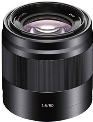
Abbildung 9.9: Eine Preis-Leistungs-Empfehlung wert: das Sony E 50 mm F1,8 OSS. Eine große Anfangsöffnung von f1,8 hilft beim Freistellen eines Vordergrundmotivs vor einem unscharfen Hintergrund.

Weitere Vorteile ergeben sich bei lichtstarken Objektiven durch die harmonische Darstellung des in Unschärfe verschwimmenden Hintergrunds. Wenn Sie die Vordergrunde vom Hintergrund freistellen möchten, dann stellen Sie den kleinsten Blendenwert ein. In den beiden Aufnahmen der Blüte ist sehr schön zu erkennen, wie bei Blende f5,6 noch ein recht unruhiger Hintergrund vorhanden ist. Bei Blende f2,8 verwischt dieser harmonisch.