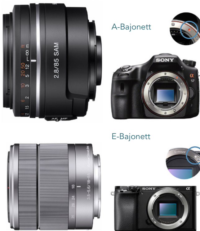
Abbildung 9.11: Die Objektive mit Sonys A-Bajonett sind nicht kompatibel mit dem Ihrer a6100. Diese verfügt über das E-Bajonett. Mit einem Adapter können Sie die A-Bajonett-Objektive allerdings verwenden, ebenso wie viele Fremdobjektive ohne E-Bajonett.

Viele Zoomobjektive variieren in der Lichtstärke über den einstellbaren Brennweitenbereich. Das Kit-Objektiv E PZ 16–50 mm F3,5–5,6 OSS besitzt eine Lichtstärke von f3,5 bei 16 mm Brennweite. Diese ändert sich stufenweise bis f5,6 bei 50 mm Brennweite. Teurere Objektive wie das Sony FE 70–200 mm F2,8 GM OSS besitzen eine durchgehend hohe Lichtstärke von f2,8.