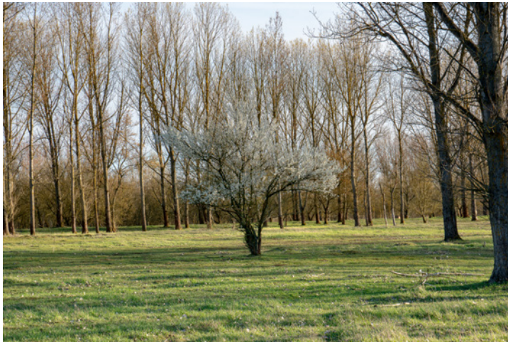
Abbildung 9.4: In Telestellung aufgenommene Szene 50 mm | f11 | 1/60 s | ISO 200