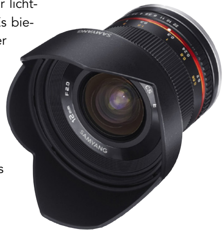
Abbildung 9.14: Superweitwinkelobjektiv Samyang F2.0/12 mm NCS CS

Ein sehr interessantes Weitwinkelobjektiv ist das Samyang F2.0/12 mm NCS CS . Dieses Objektiv liefert an der \alpha 6100 eine hervorragende Bildqualität. Außerdem ist es sehr lichtstark, was auch Aufnahmen bei wenig Licht erlaubt. Es bietet sich daher u. a. sehr gut für Astrofotografie an. Aber auch für Landschafts- und Innenaufnahmen ist das Objektiv wie geschaffen. Allerdings müssen Sie hier auf eine automatische Fokussierung verzichten. Das lässt sich aber in diesem extremen Weitwinkelbereich verschmerzen, da der Schärfentiefebereich hier selbst bei offener Blende schon recht groß ist. Ein Bildstabilisator wurde nicht verbaut. Die Verarbeitung des Objektivs erfolgt auf einem hohen Niveau.