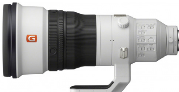
Abbildung 9.1: Sonys 400-mm- Profi-Brennweite für 12.000 Euro

Letztlich ist das Objektiv nichts anderes als ein zylindrischer Körper mit mehreren Linsen aus speziellem Glas. Diese bündeln das Licht und leiten es ins Innere der Kamera weiter. Dort gelangt es zum Sucher, zu den Sensoren und natürlich auch auf den Bildsensor. Das menschliche Auge funktioniert ähnlich. Auch hier wird das Licht über unsere Hornhaut durch die Iris einer Linse zugeführt, welche die Strahlen zur Netzhaut leitet. Die dort befindlichen Sinneszellen nehmen dann das Bild auf. Scharfgestellt wird hier durch das Dehnen bzw. Stauchen der Linse.