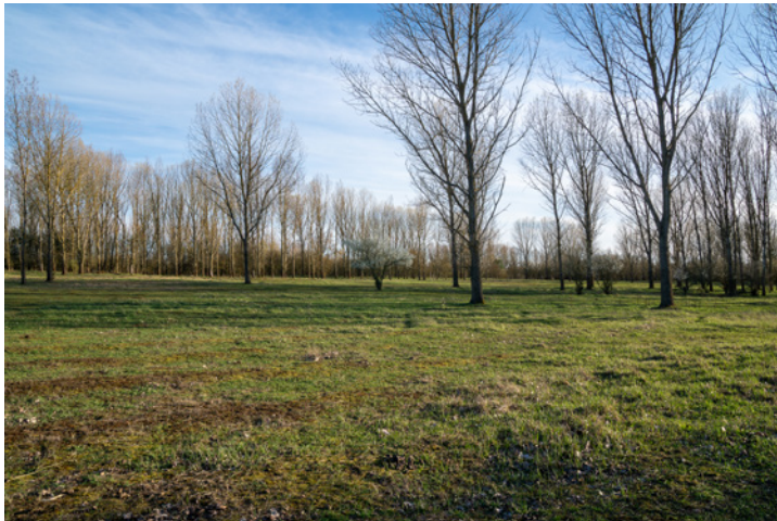
Abbildung 9.5: Die gleiche Szene, aber nun in herausge- zoomter Stellung bei 16 mm am Kit-Objektiv. 16 mm | f11 | 1/60 s | ISO 100

In Sonys mitgelieferter Software Imaging Edge Edit ist eine Vignettierungskorrektur enthalten. Sie können hiermit nicht nur die RAW-Dateien, sondern auch die JPEG-Dateien der \alpha 6100 bearbeiten und die Randabschattung mindern.