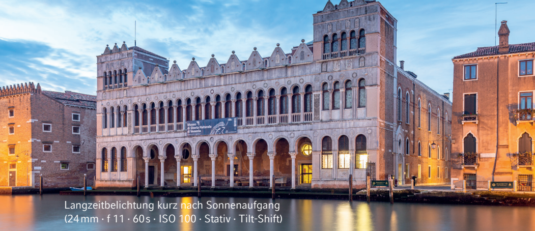
Langzeitbelichtung kurz nach Sonnenaufgang (24mm · f 11 · 60s · ISO 100 · Stativ · Tilt-Shift)