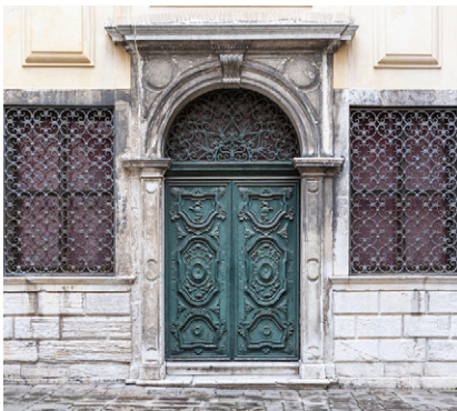
Portal der Levantinischen Synagoge (35 mm · f 6,3 · 1/250 s · ISO 400) 45.444699, 12.325730

Der Name des Viertels (Ghetto) bezog sich ursprünglich auf eine in Cannaregio ansässige Gießerei. Erst später bürgerte sich der Begriff als allgemeine Bezeichnung für ein abgegrenztes jüdisches Wohnviertel ein.