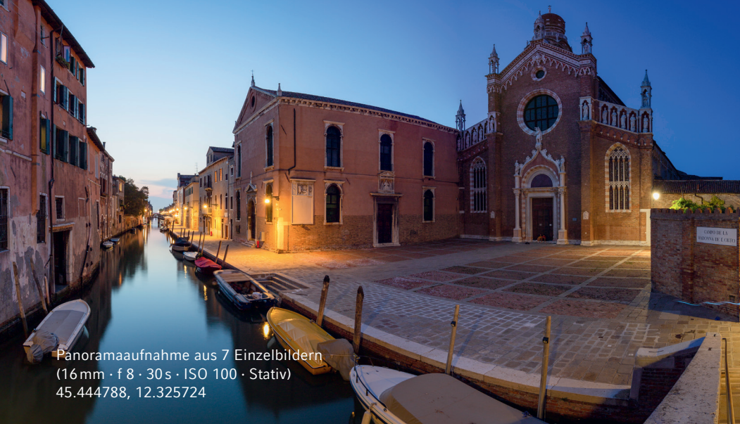
Panoramaaufnahme aus 7 Einzelbildern (16 mm · f 8 · 30 s · ISO 100 · Stativ) 45.444788, 12.325724