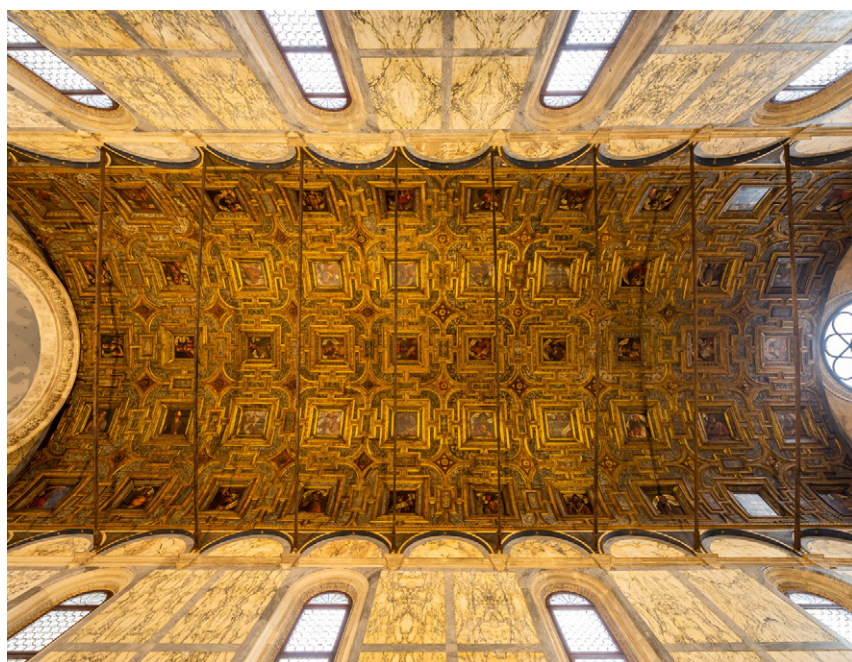
Die gewölbte Kassettendecke der Kirche Santa Maria dei Miracoli (14mm · f 8 · 4s · ISO 100 · Stativ a.A.)

Das Fotografieren in dieser Kirche ist eigentlich verboten, doch wenn man am Eingang bei der Aufsichtsperson nachfragt, macht sie nach meiner Erfahrung in der Regel eine Ausnahme.