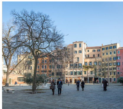
Der Campo del Ghetto Nuovo ist das Zentrum des ältesten Ghettos der Welt. (24 mm · f 7,1 · 1/640 s · ISO 200) 45.445372, 12.326673