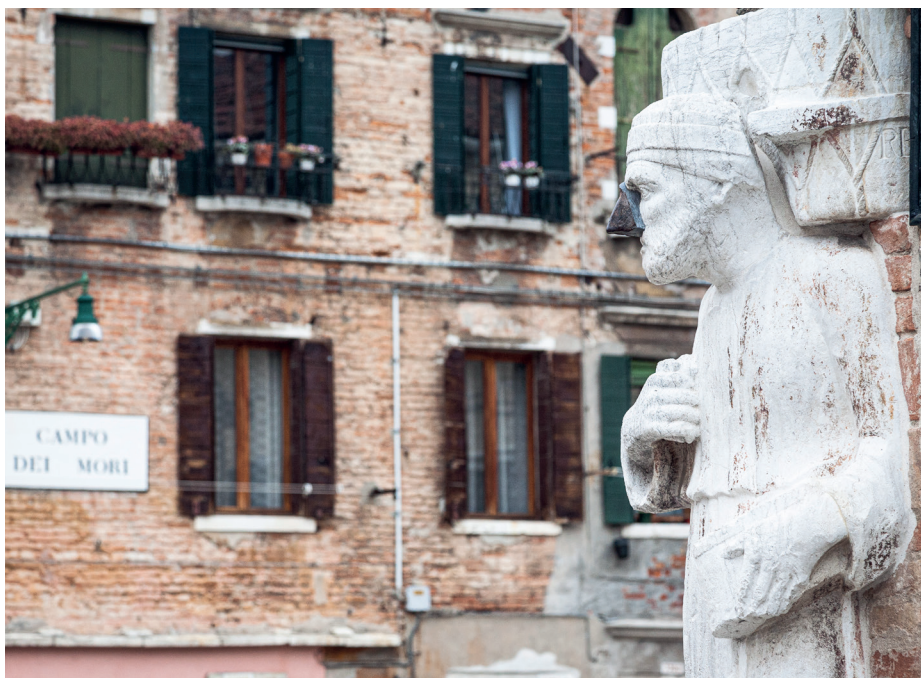
Die Eckfigur des Signor Antonio Rioba (105 mm · f 8 · 1/320 s · ISO 400) 45.445350, 12.332132

Die Eckfigur zeigt den Signor Antonio Rioba, eine sogenannte »sprechende Statue«, an deren im 19. Jahrhundert hinzugefügter rostiger Eisennase Venezianer anonyme Kritiken und Satiren gegen die Obrigkeit hinterließen.