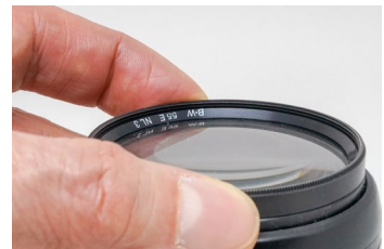
Abbildung 11.3: Nahlinse NL 3 von B&W zum Aufschauben auf das Filtergewinde des Objektivs

Ein Nachteil ist, dass man für jeden Filterdurchmesser eine gesonderte Linse benötigt. Die Stärke oder, besser gesagt, die Brechkraft einer Nahlinse wird in Dioptrien angegeben. Die Brechkraft ist das Maß dafür, wie stark Lichtstrahlen durch eine optische Struktur – in diesem Fall eine Linse – gebrochen werden. Der Hersteller B&W (Jos. Schneider Optische Werke