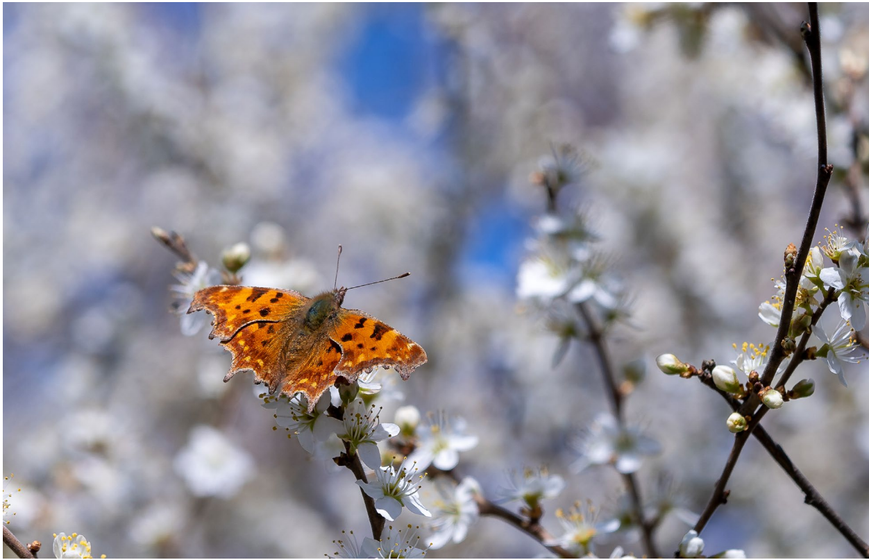
Abbildung 11.6: Nutzen Sie ein Einbeinstativ, um wie hier gezielt auf bestimmte Motivbereiche korrekt scharfzustellen. Damit bleiben Sie auch relativ flexibel, was bei sich schnell bewegenden Motiven von Vorteil ist.

90mm | f5 | 1/500s | ISO 100 | Einbeinstativ