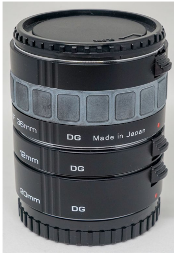
Abbildung 11.5: Achten Sie beim Kauf von Zwischenringen darauf, dass Kontakte vorhanden sind. Ansonsten werden diese Zwischenringe nicht alle Funktionen Ihrer a7C unterstützen.

nicht gemindert. Auch kann man sie an allen Objektiven nutzen – ein weiterer Vorteil.