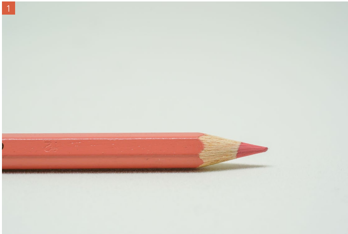
Abbildung 11.4: Eine Makroaufnahme ohne ❶ und mit einer Nahlinse mit der Vergrößerungsstärke von +3 Dioptrien ❷ 50 mm | f8 | 1/60s | ISO 320 | Stativ