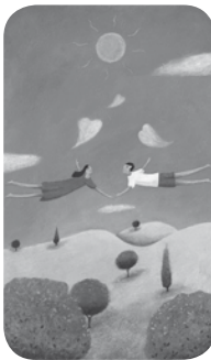
13 Auf Wolken schweben