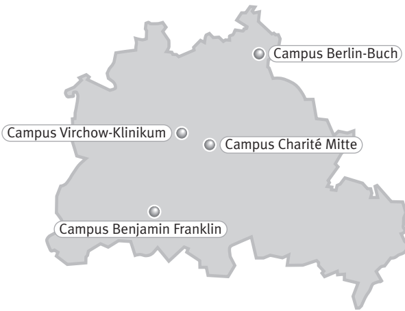
Die vier Standorte der Charité in den Berliner Stadtgrenzen.

Netzwerk wissenschaftlicher Tätigkeit entstanden, in dem mutige und ehrgeizige Pläne für eine evolutionäre Zukunft der Medizin entworfen werden. Dies geschieht in der Hoffnung, das große Versprechen von Gesundheit immer besser einlösen zu können, das mit dem Aufkommen des modernen wissenschaftlichen Denkens im Europa des frühen 17. Jahrhunderts zwar vorsichtig, aber klar vorgegeben worden ist und an dessen Umsetzung wir letzten Endes von der Geschichte gemessen werden.