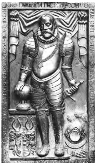
Das Grabmal Tycho de Brahes in der Teynkirche

Die große Kirchentür fiel donnernd ins Schloß und gab Binder einen furchtbaren Schlag vor die Stirn.