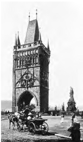
Der Altstädter Brückenturm mit dem Karlsmonument

erst unter seinem Sohn Wenzel IV. (1378–1419) fertiggestellt wurde. Die beiden Herrscher sind oberhalb des Torbogens als Sitzfiguren abgebildet, zwischen denen eine abgekürzte Darstellung der Karlsbrücke zu sehen ist. Darüber, gleichsam als plastischer Schmuck sich über deren Mittelpfeiler erhebend, ist der hl. Veit dargestellt, der Schutzpatron Böhmens. Ganz oben, an der durchbrochenen Galerie mit den von Türmchen bekrönten Ecken, waren zehn Jahre lang die Köpfe der 27 böhmischen Aufständischen aufgepfählt, die 1621 auf dem Altstädter Ring hingerichtet wurden. (Vgl. S. 170) 1648 trotzte der Turm den von der Kleinseite her angreifenden Schweden, denen es nicht gelang, die Altstadt zu besetzen. Zu den literarischen Werken, die auf dieses Ereignis anspielen, gehört Rilkes Gedicht Frieden aus den Larenopfern (1895).