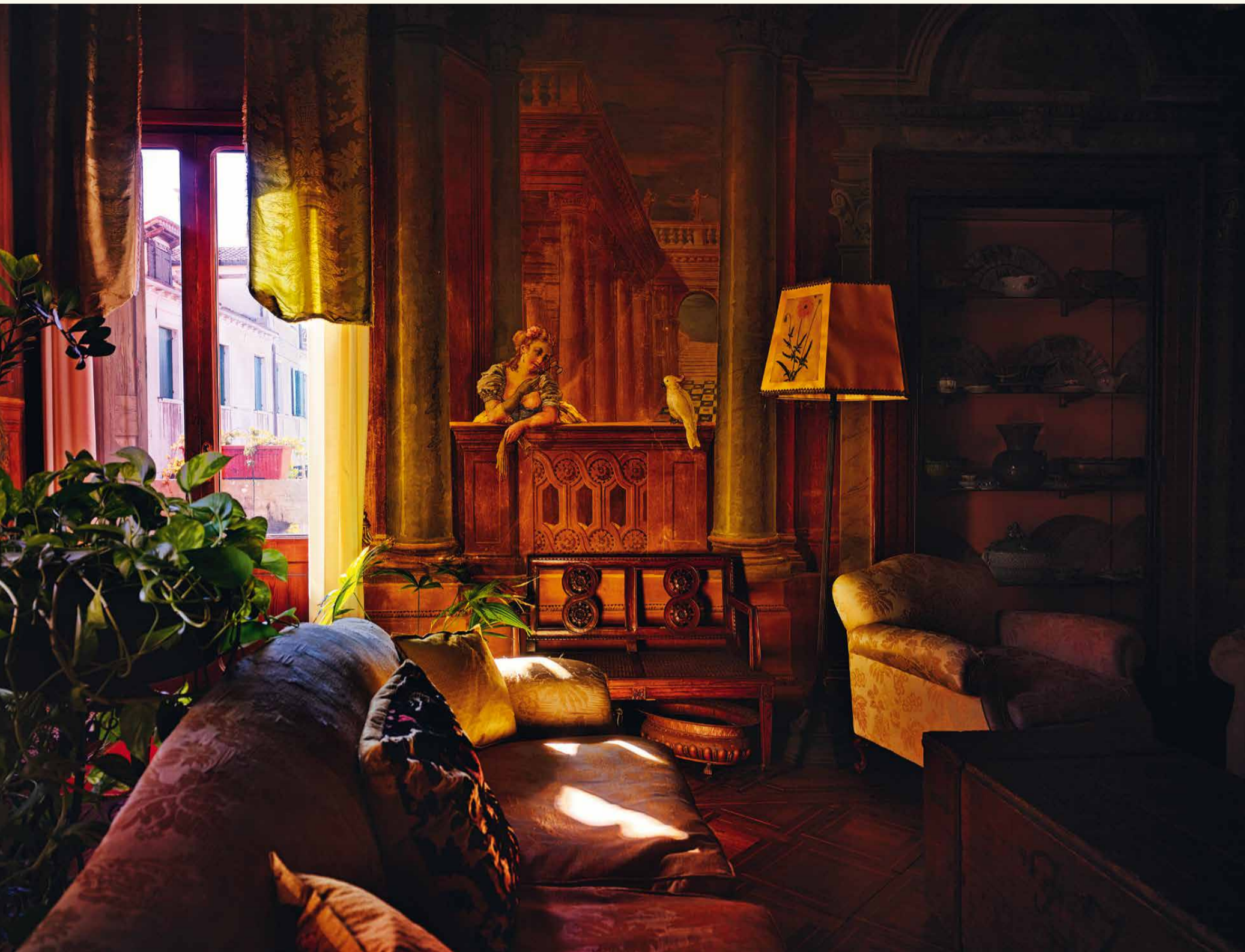
CA' MARCELLO SESTIERE S MARCO Beaqui totatia vellibus et mi, asperum rem et fugia con consequ atiatas. ~ Englische Übersetzungetur molo to rem et fugia con