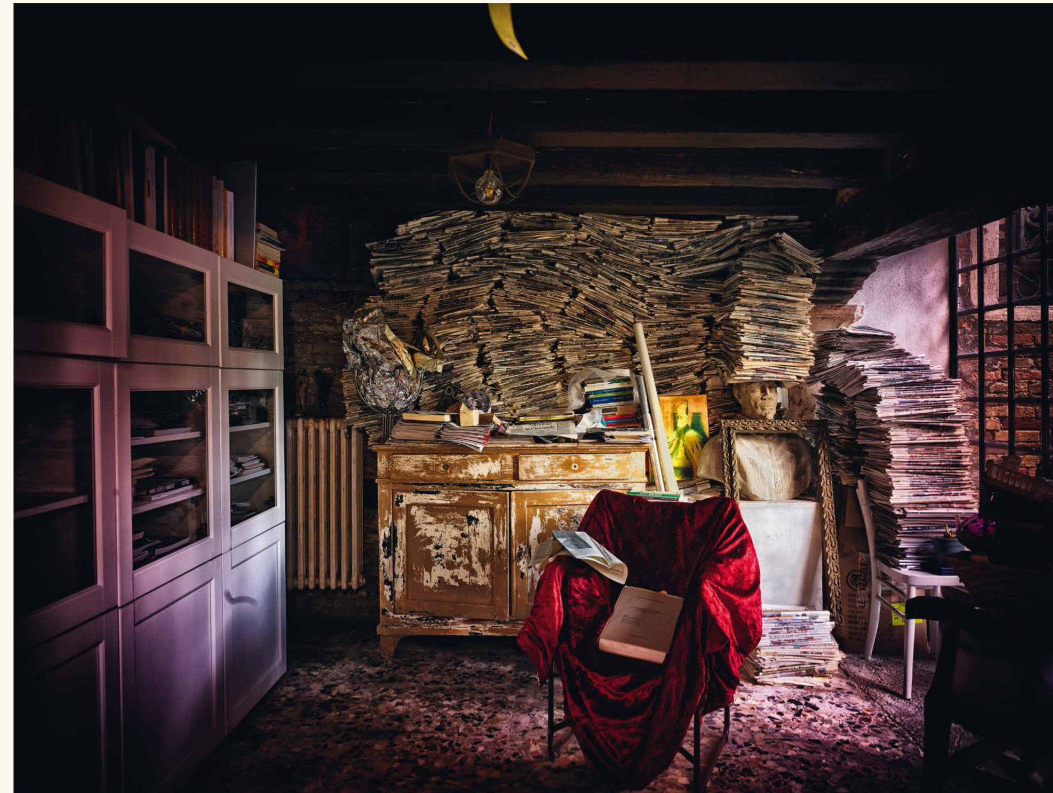
CASA DE LUIGI 38 Beaqui totatia vellibus et mi, asperum rem et fugia con consequ atiatas. ~ Englische Übersetzungetur molo to rem et fugia con consequ atiatas. dolupit